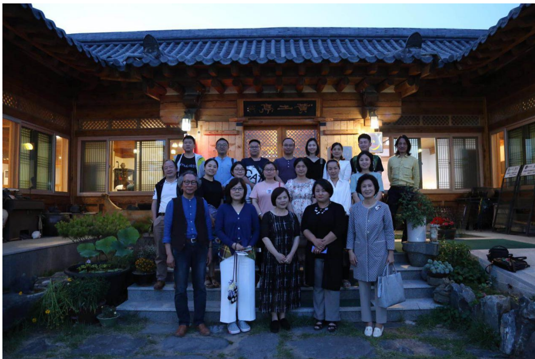
图 5 晚宴后与授课教授们合影