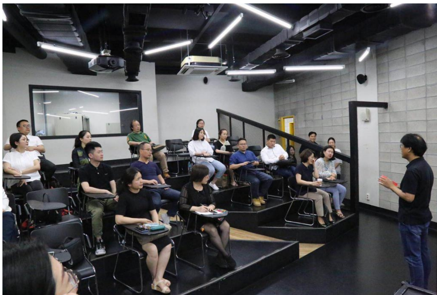
图 10 老师们听取校方介绍韩国综合艺术大学情况

本次参访的是位于石串校区的影像院，包含有动画制作等与湖南工艺美术学院相贴合的专业。