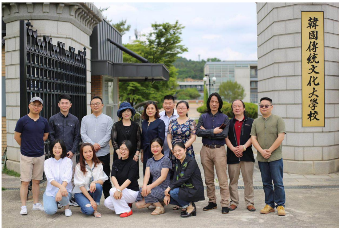
图 1 湖南工艺美术职业学院在韩国传统文化大学门口合影

作为校训把韩国传统文化作为基础培养把传统文化不断地创新和继承的专门人才作为目标。