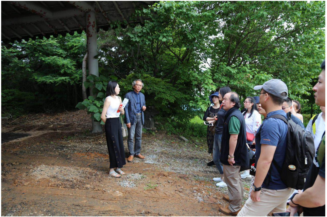
图4 参观校内陶瓷烧制龙窑

此外，在助教的带领下，老师们还参观了校内保留并部分重新修的韩国传统建筑。在与校方的晚宴上，研修团老师们表示在这两天的课程中都收获颇丰，纷纷与自己专业相关的教授畅所欲言，讨论中韩两国文化之间的联结与差异，并对进一步的合作与交流表示了期待。