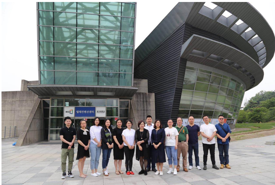
图 8 在京畿道大学图书馆前合影

此次将京畿道大学列为参访学校，是因为为了培养具有竞争力的全球性人才，促进国际教育与研究的发展，京畿大学已经与中国、美国、俄罗斯、日本等 38 个国家的 220 所大学有签订了姊妹大学协议，是一所具有国际视野的开放包容的大学。同时，为了外国留学生的生活便利，设立了两栋 22 层的现代化男、女宿舍楼（2 人 1 室）。在首都圈内的语言学院中性价比较高的语言学院。为了迈进首都圈大学以及全国前 10 位大学之列，京畿大学校正在尽全力努力改善。