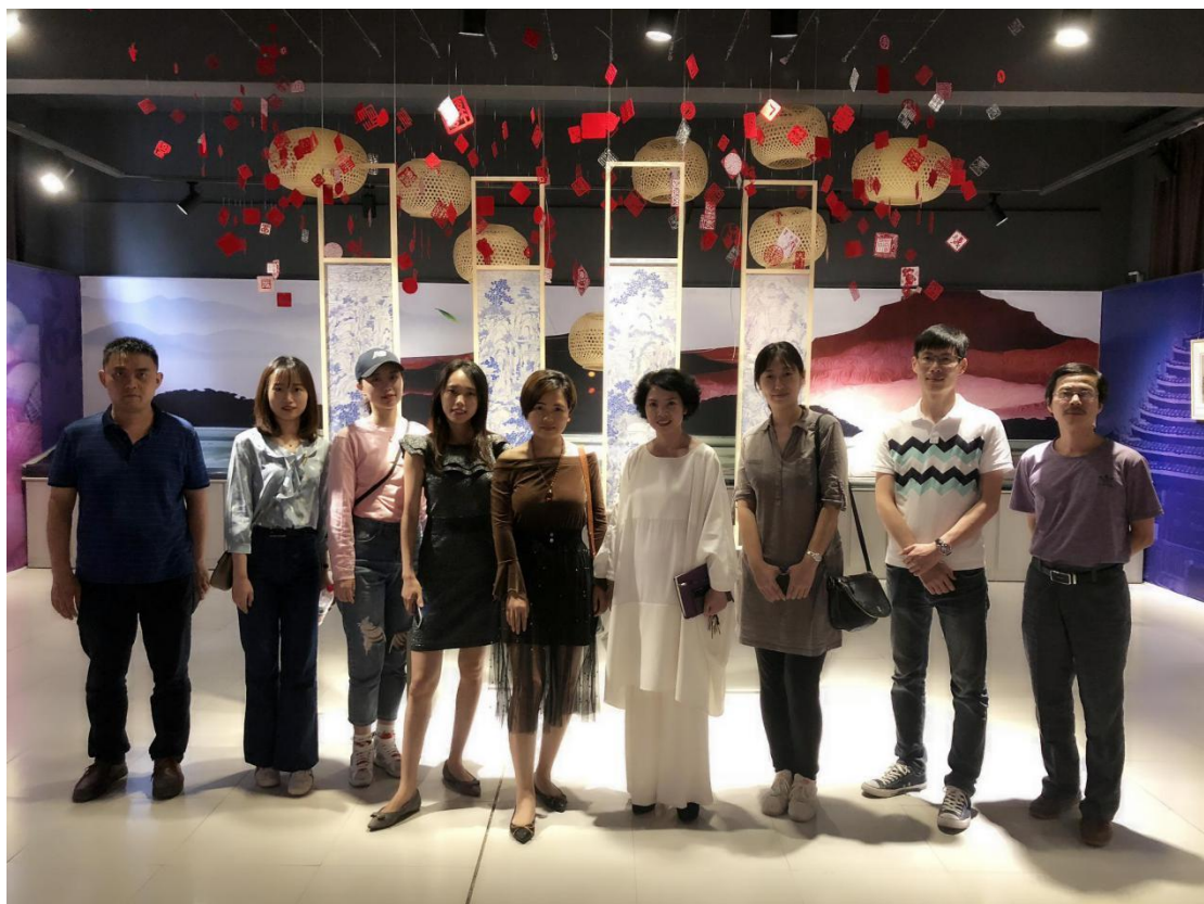
图8 2019年与长沙师范学院艺术设计系教师进行毕业设计作品交流