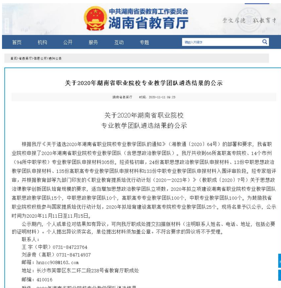
图 1 通知文件（1）

2020 年学校重点打造刺绣设计与工艺、服装与服饰设计以及环境艺术设计 3 个专业教学团队，并于 2020 年 11 月成功立项为省级专业教学团队。