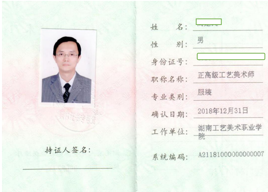
图 1 正高级工艺美术师