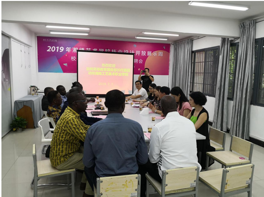
图9 2019年与加纳高等教育国务部长代表团进行交流