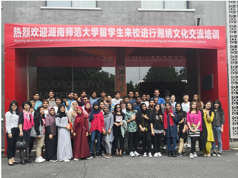
图 11 参加 2019 年湖南师范大学留学生湘绣文化交流培训