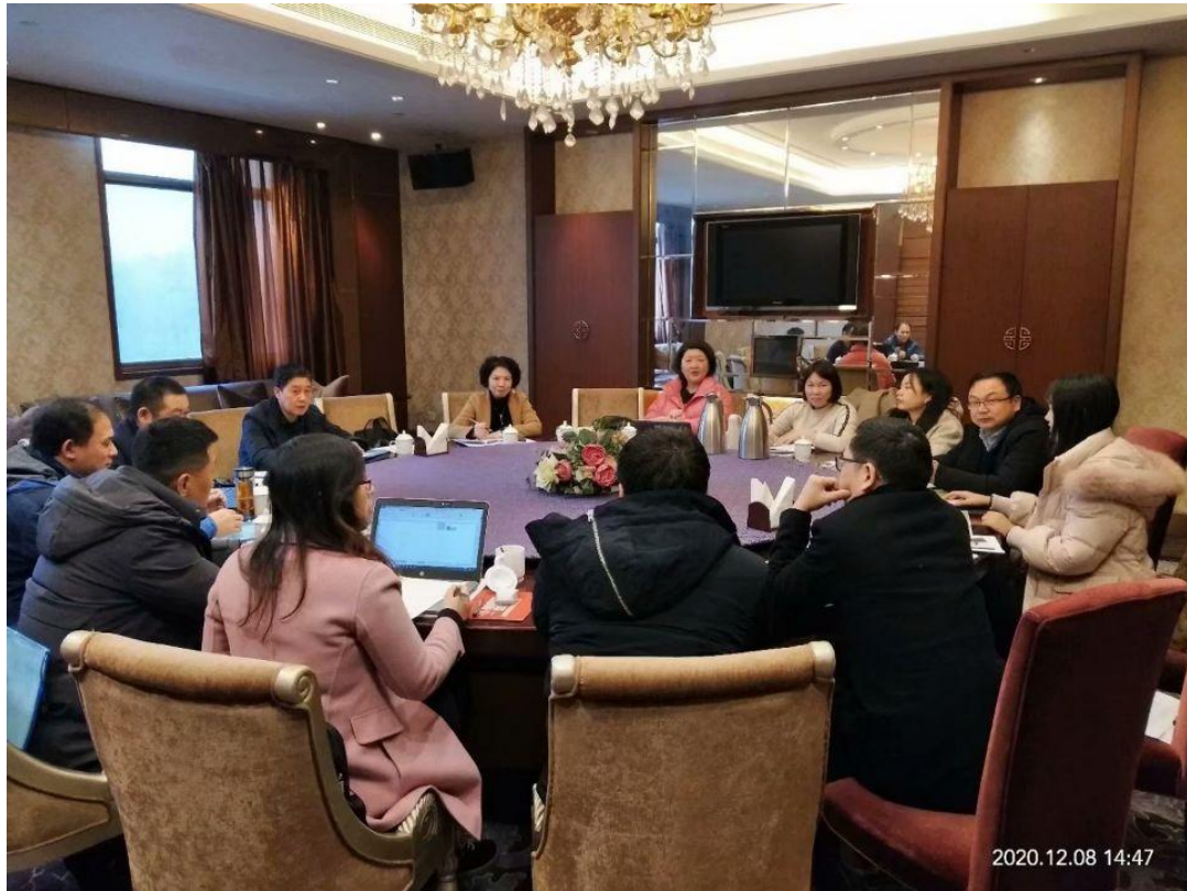
图7 参加2020省级专业教学团队项目负责人培训