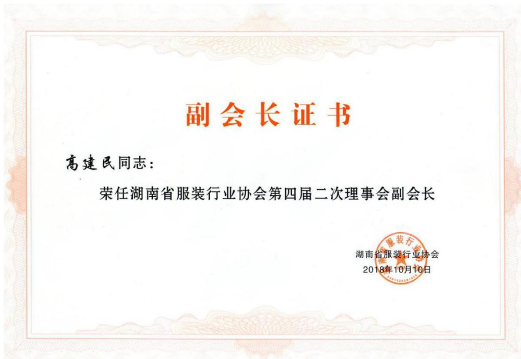
图4 湖南省服装行业协会副会长