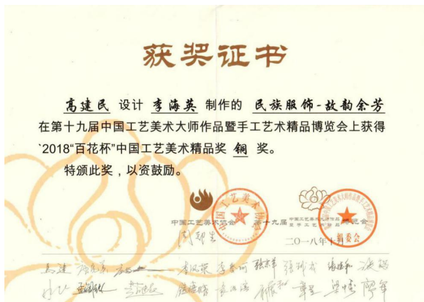
图7 作品获2018“百花杯”中国工艺美术精品奖一铜奖