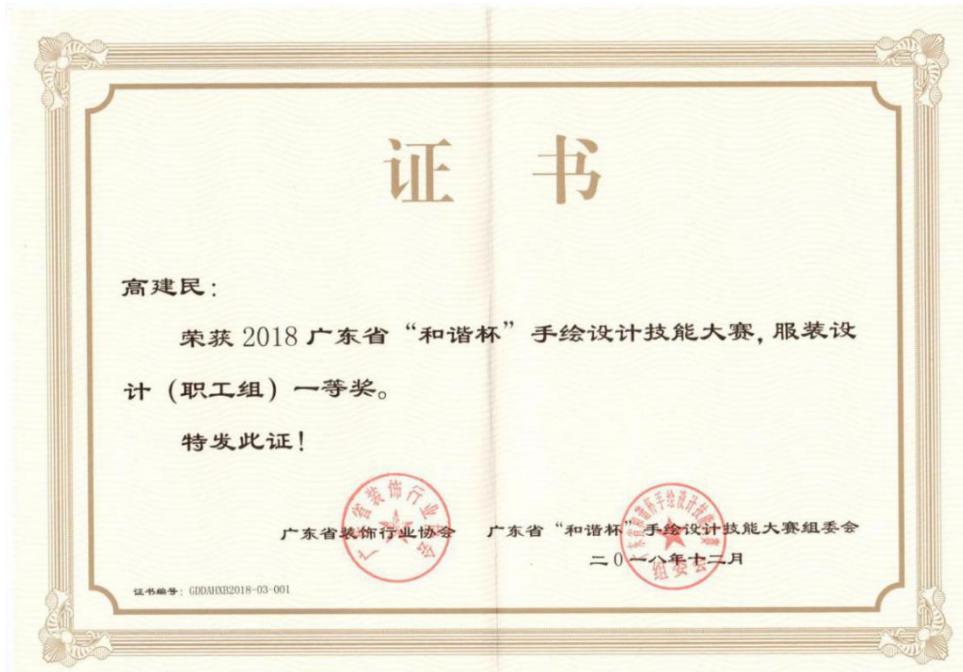
图 8 获“和谐杯”手绘设计技能大赛 一等奖