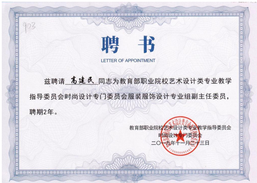
图 2 教育部教指委副主任委员