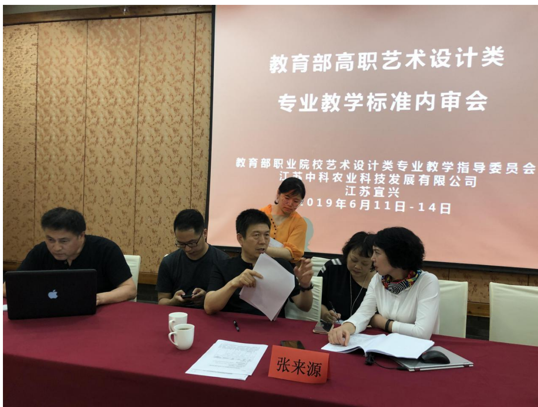
图10 2019年参加教育部高职艺术设计类专业教学标准内审会