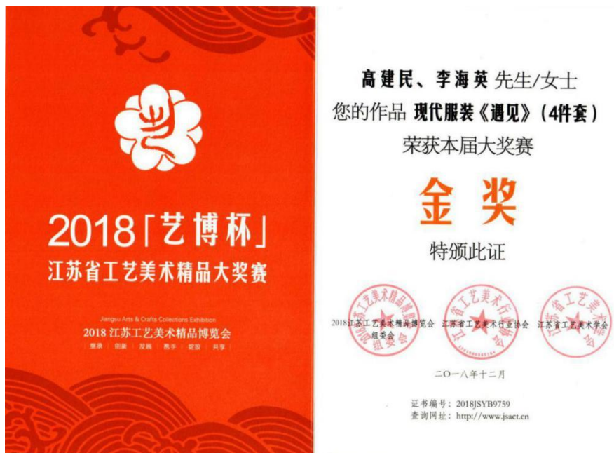
图 9 获“艺博杯”江苏省工艺美术精品大赛金奖