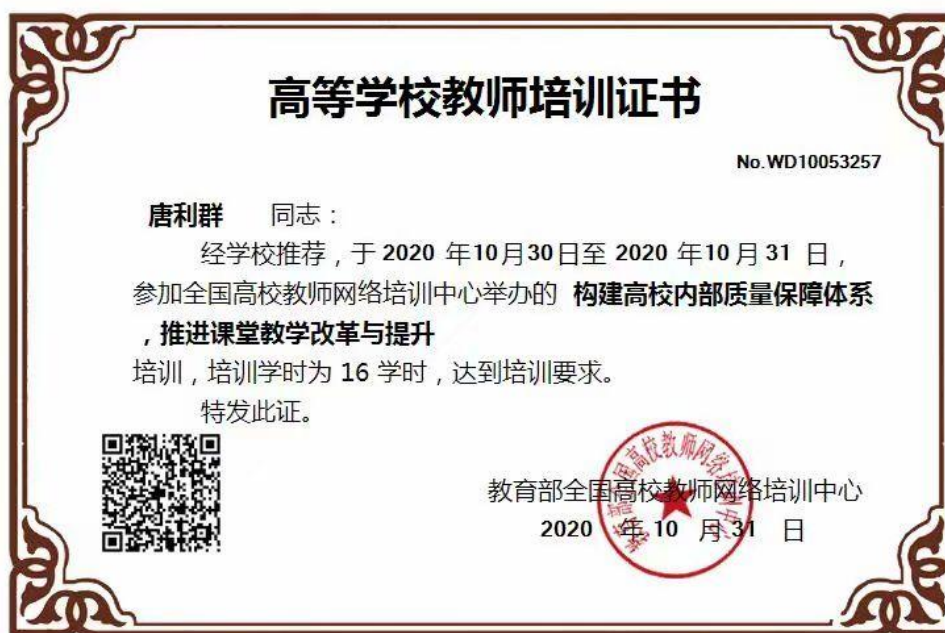
图 4 唐利群参加教育部全国高校教师网络培训中心举办的“构建高校内部质量保障体系，推进课堂教学改革与提升”