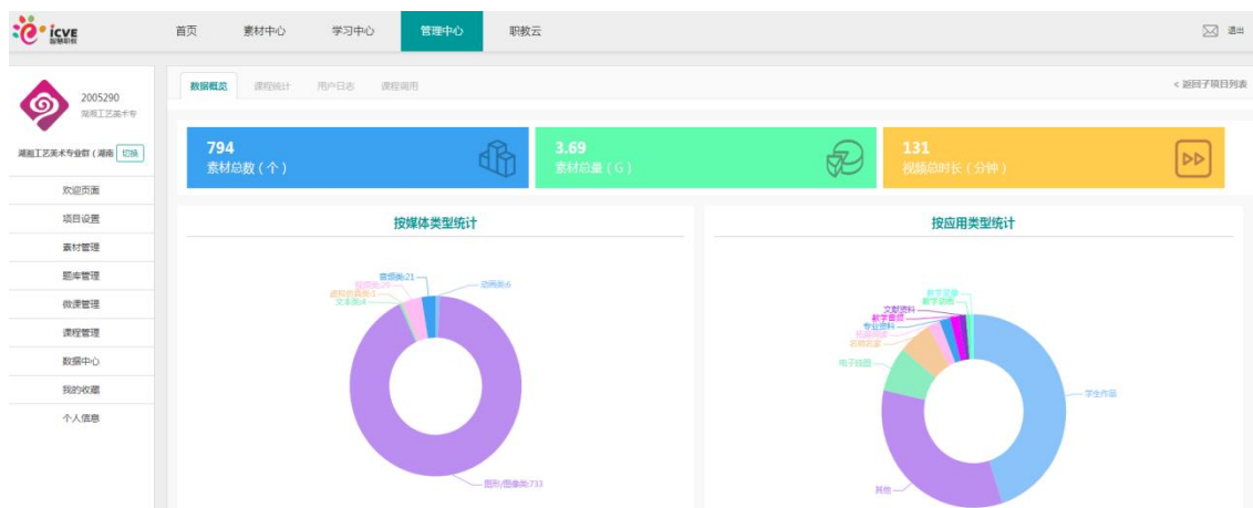
博物馆素材统计图