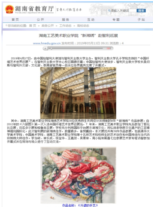
图2 湖南省教育厅新闻报道