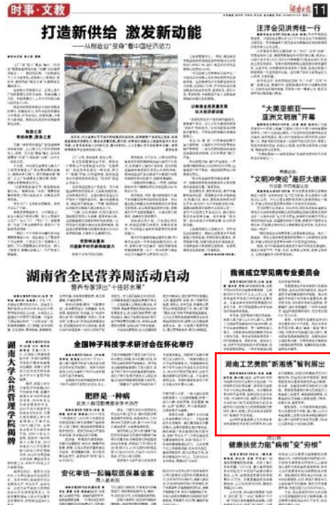
图1 湖南日报新闻报道

展览期间,不少前来参观的国际友人驻足欣赏并留影。据了解,自2012年起湖南工艺美术职业学院的湘绣作品入选中国纤维艺术世界巡展,7年来已先后参加了4次国际巡展。