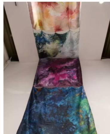
图4 从洛桑到北京国际纤维艺术双年展公众号新闻报道