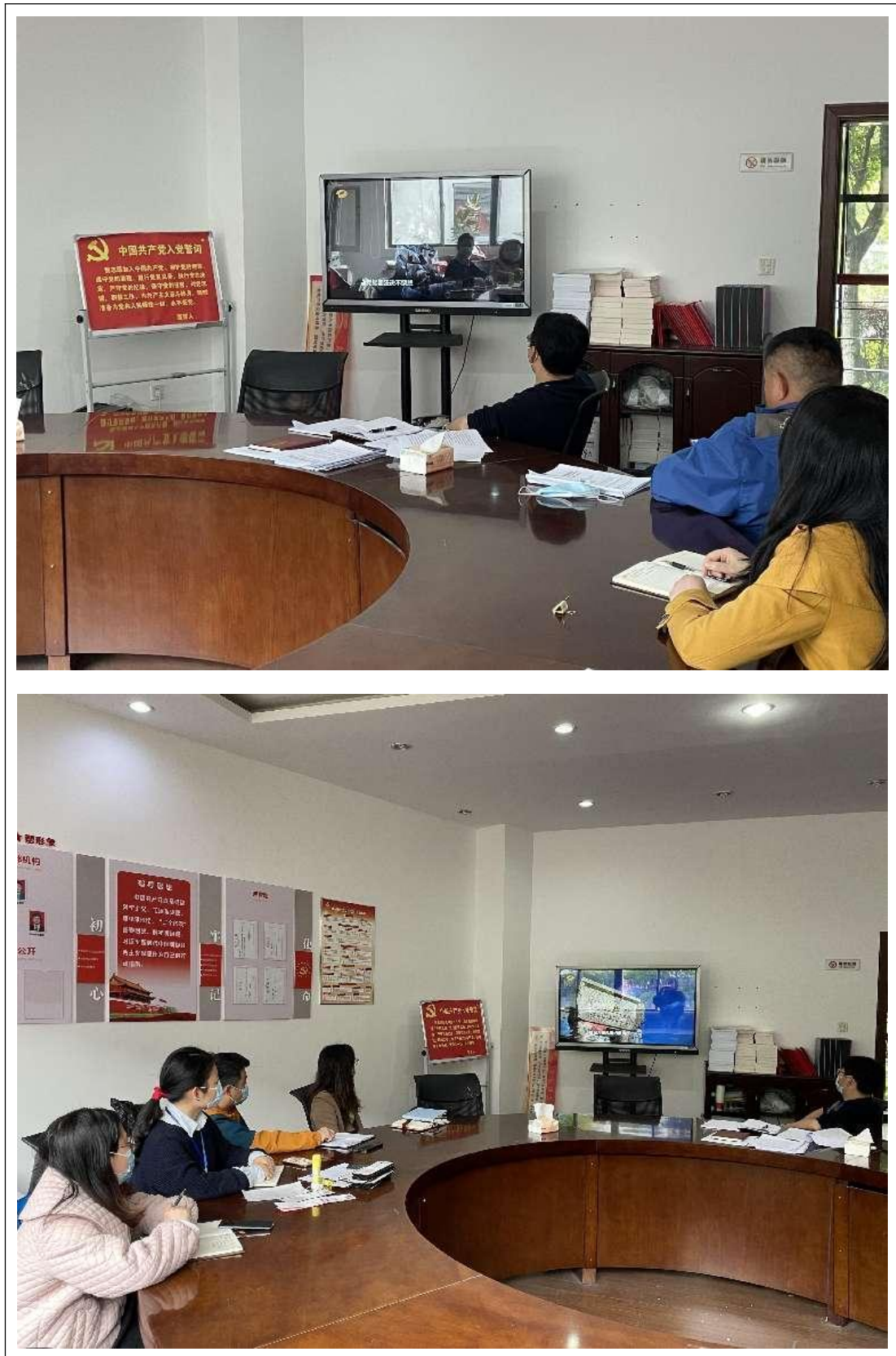
图 2 组织观看专题片