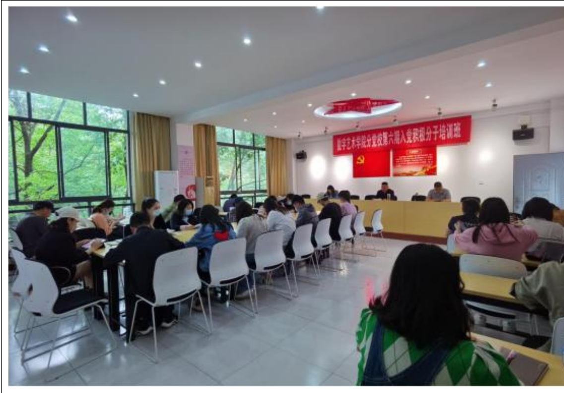
图 1 师德师风建设学习教育现场