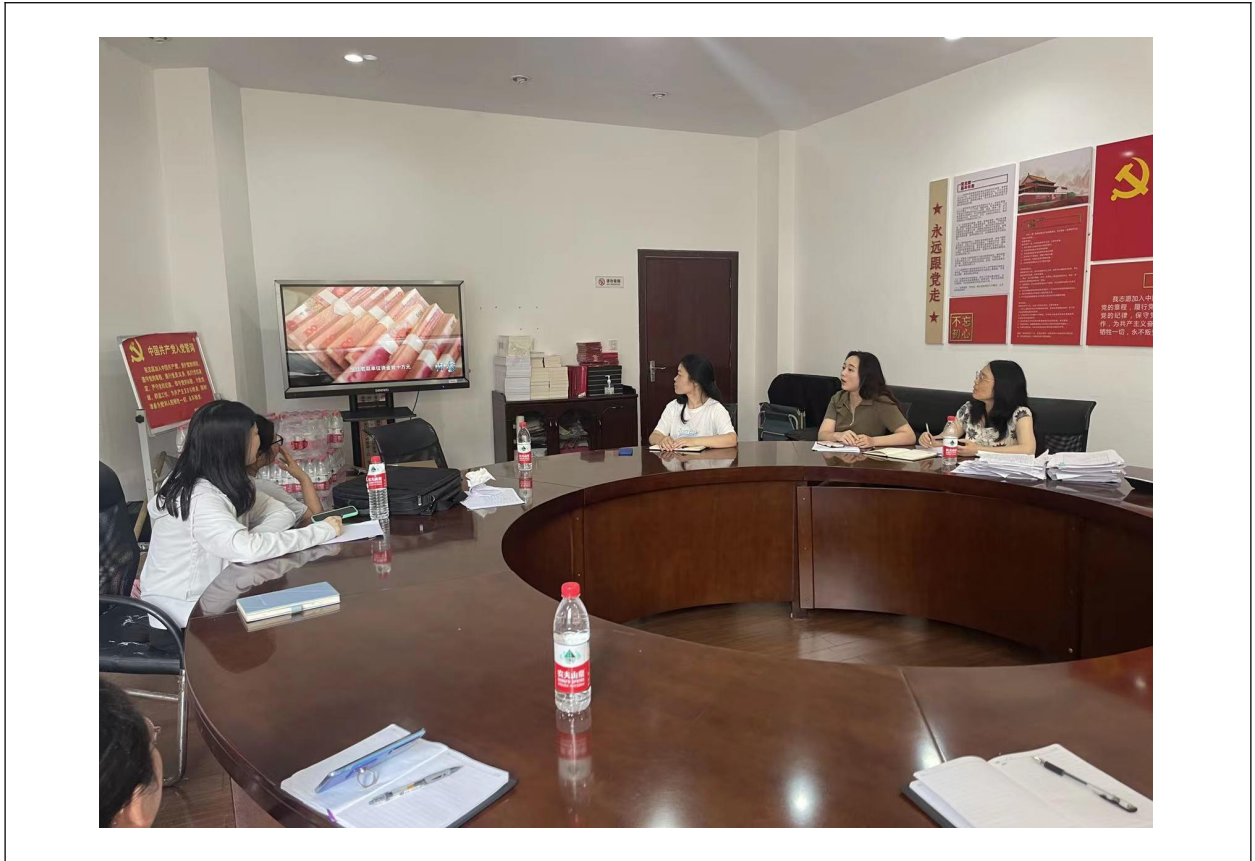
图 1 组织人事处党支部集中观看警示教育片《师蠹》