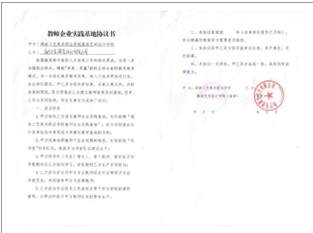
图 2 协议书