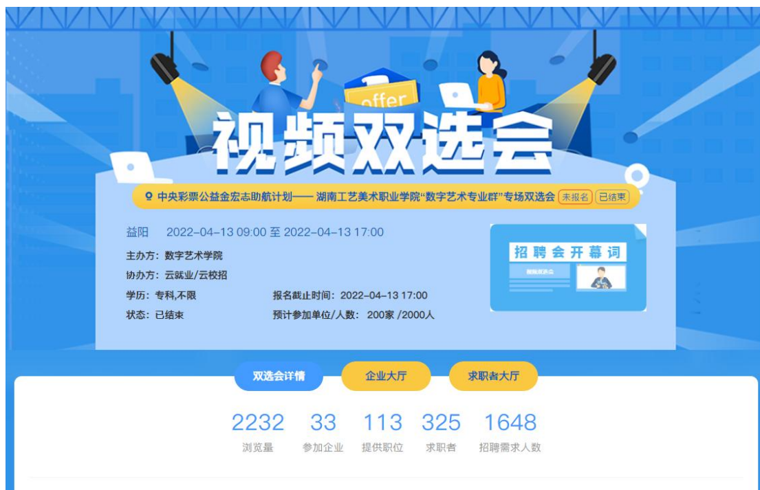
图 1 数字艺术学院招聘会邀请函