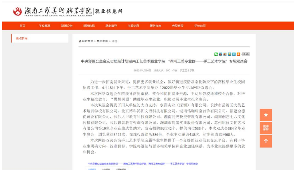
图 2 手工艺术学院招聘会新闻