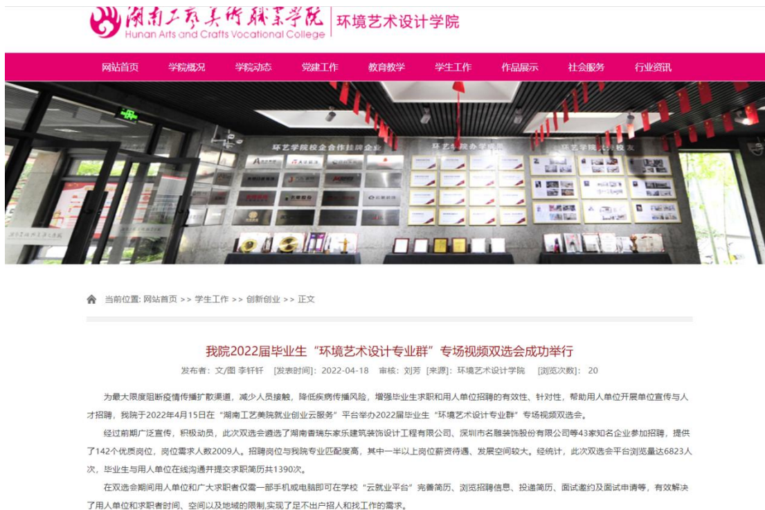
图 2 环艺学院招聘会新闻