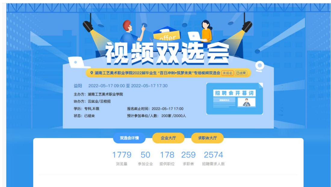
图 1 双选会邀请函

5 月 17 日，湖南工艺美术职业学院 2022 届毕业生“百日冲刺·筑梦未来”专场视频双选会