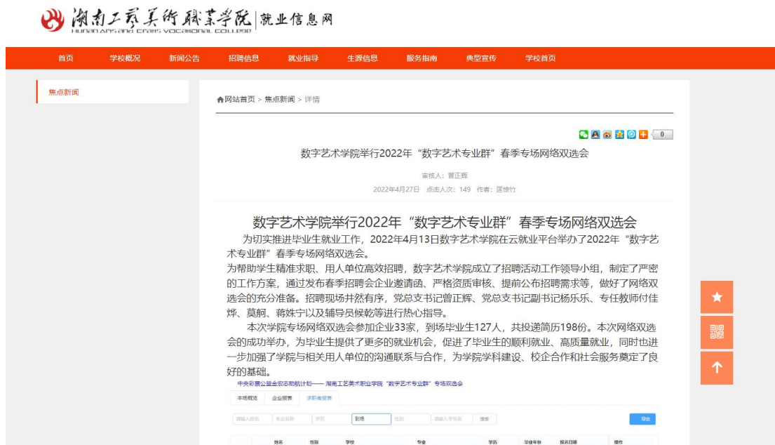
图 2 数字学院招聘会新闻