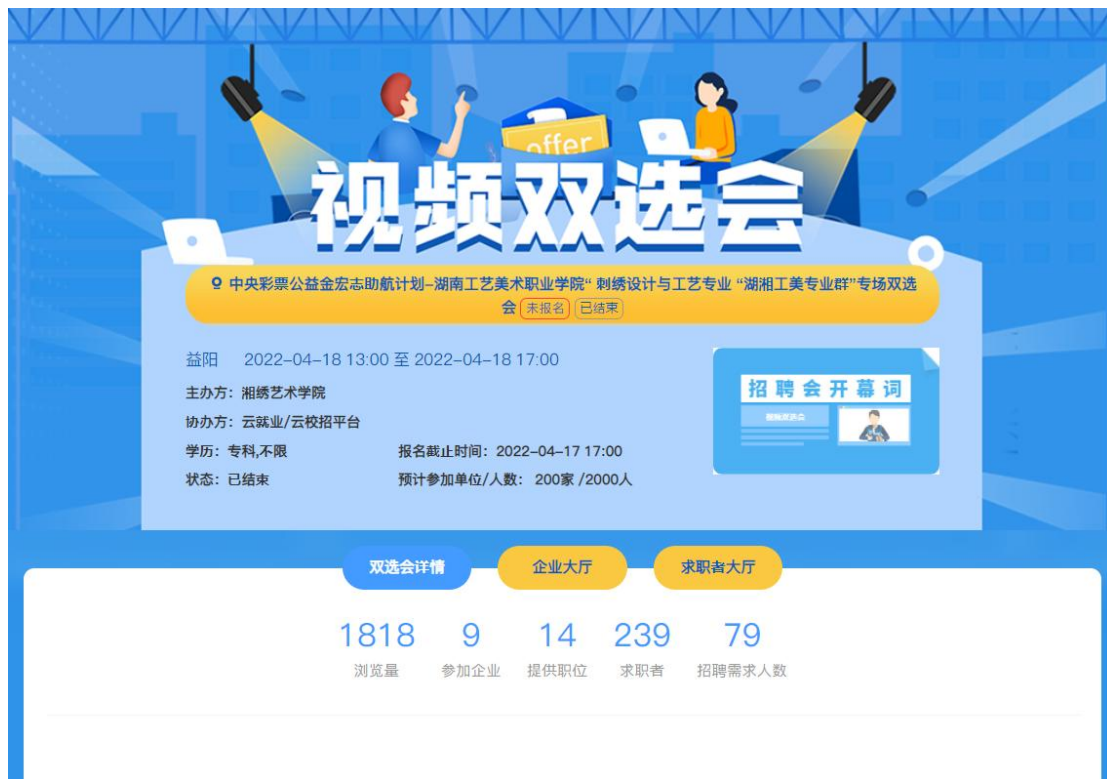
图 1 湘绣艺术学院招聘会邀请函