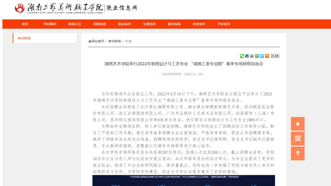
图 2 湘绣学院招聘会新闻