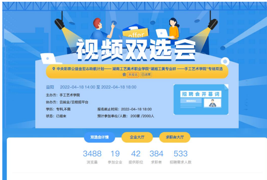
图 1 手工艺术学院招聘会邀请函