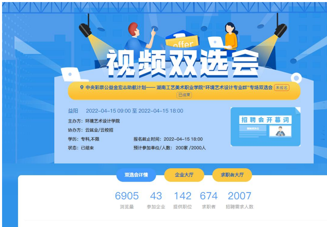
图 1 环艺学院招聘会邀请函