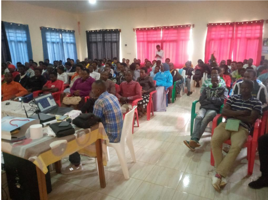
外籍学生国外收看现场