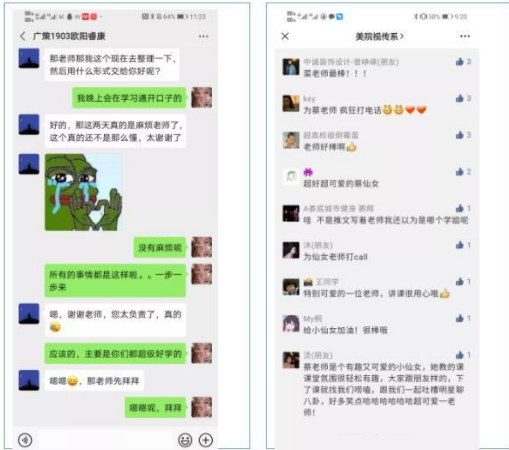
(督导查课后网课总结的褒奖)