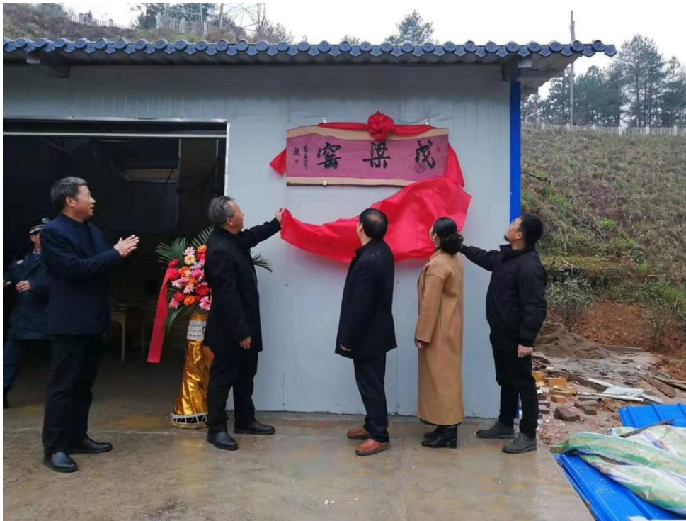
图 3 帮助通道职中建设柴窑 1 座