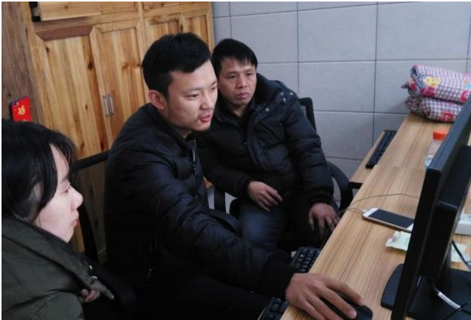
图5 水晶老师在通道职中开展精雕软件培训