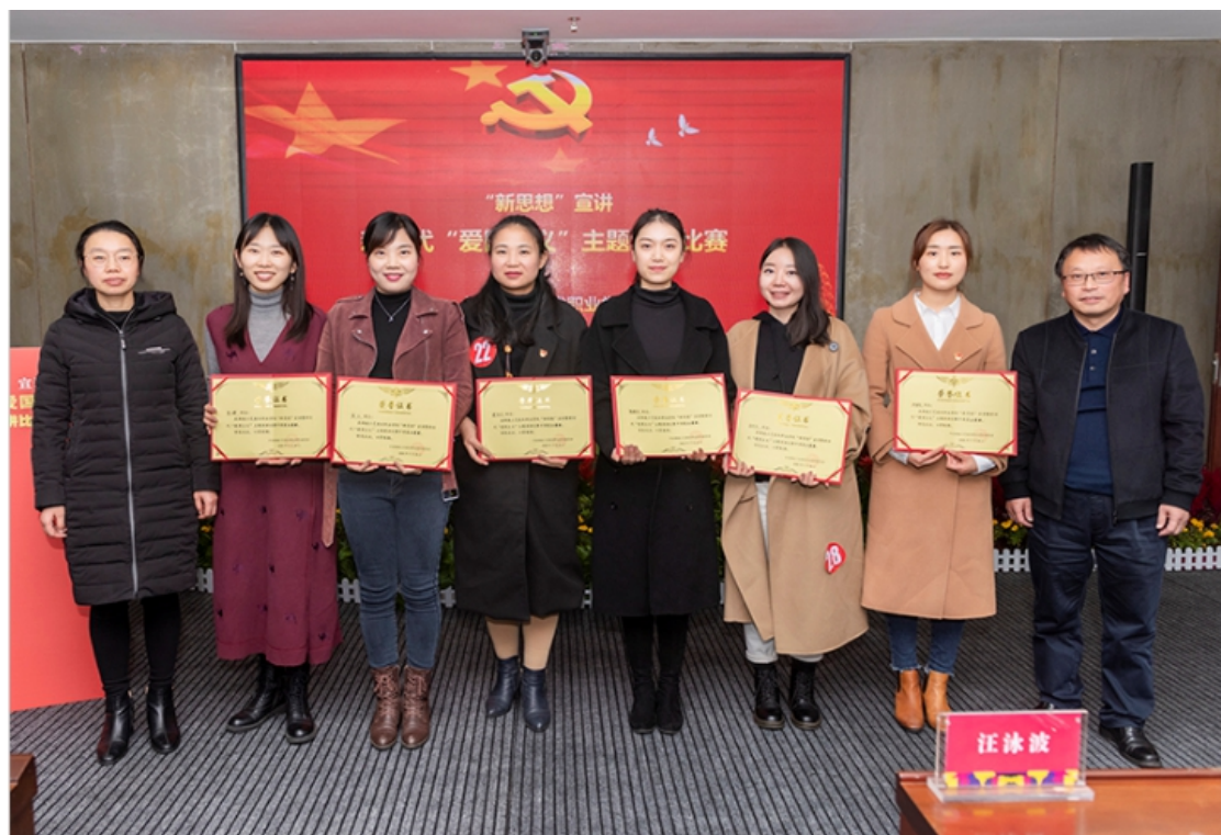
学校领导为选手颁奖