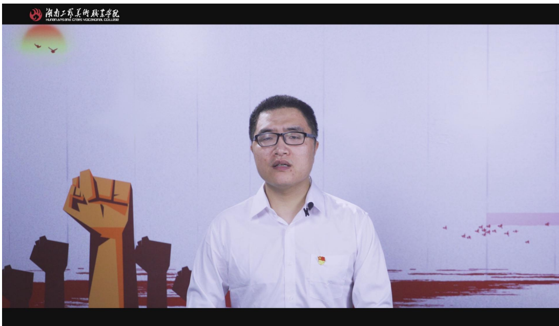
《团结战“疫”，共筑中国梦》——长沙基地综合办汨路路宣讲