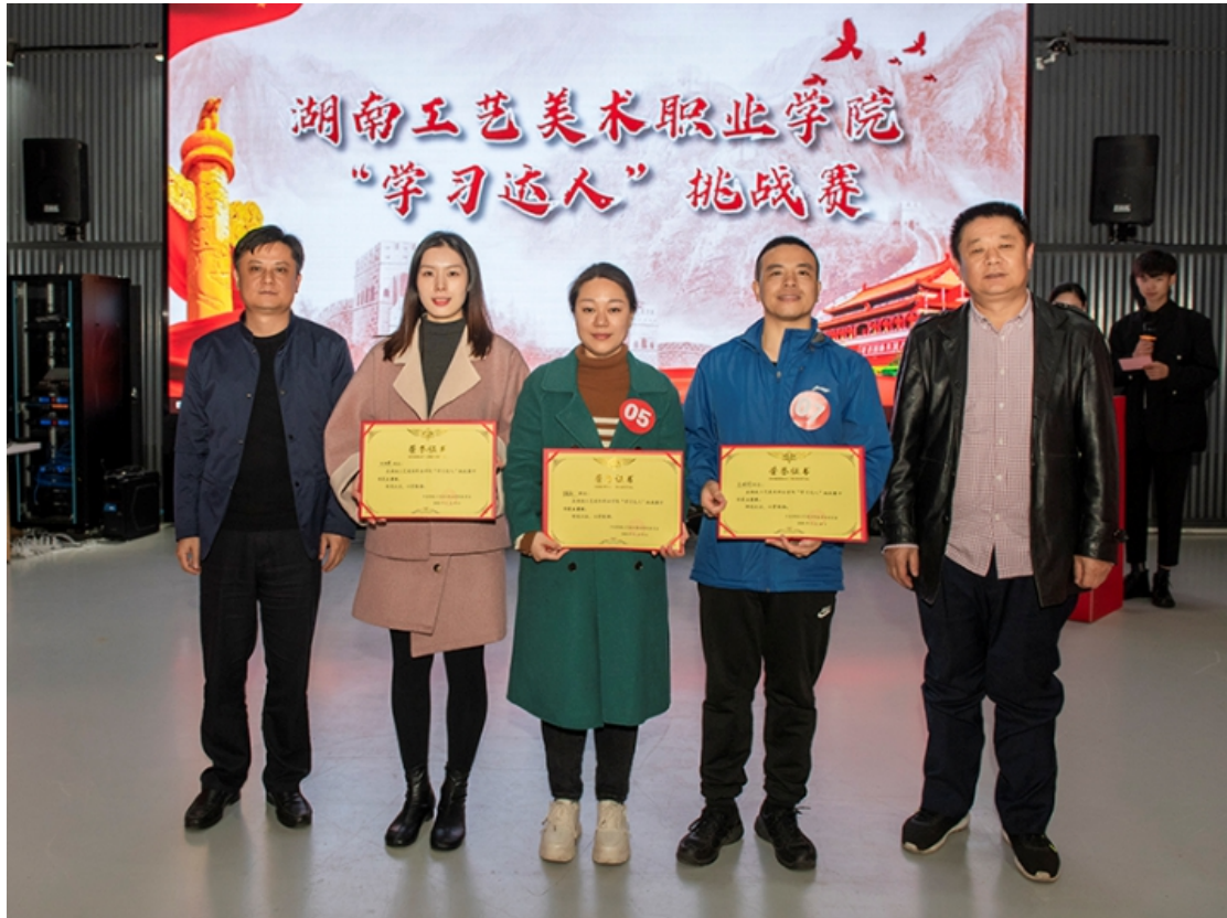
领导为获奖选手颁奖