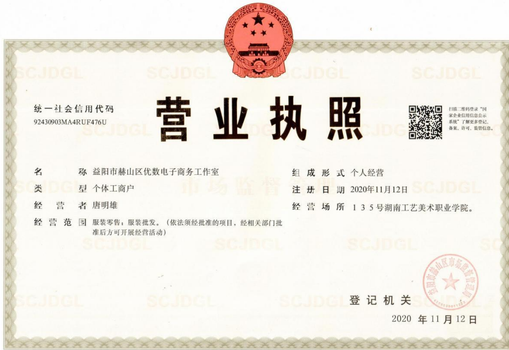
益阳市赫山区优数电子商务工作室