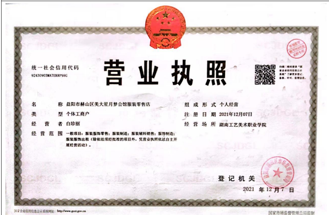
益阳市赫山区美大星月梦公馆服装零售店