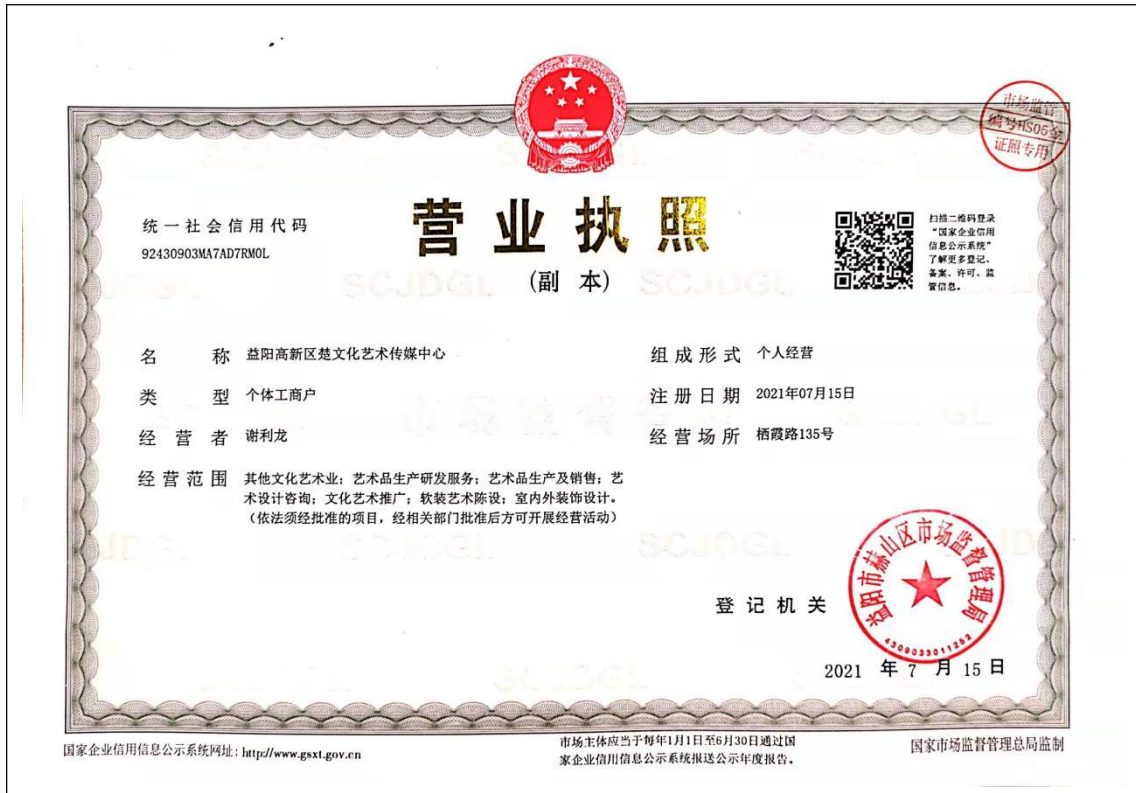
益阳高新区楚文化艺术传媒中心