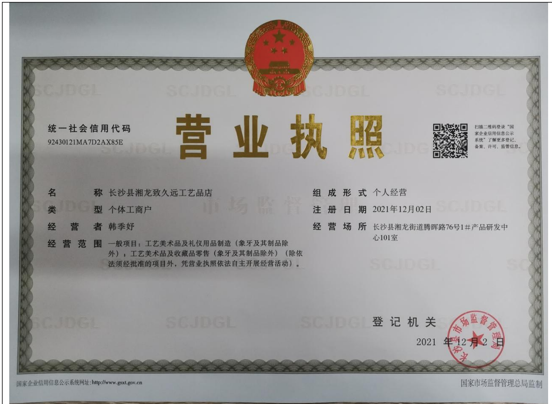
长沙县湘龙志久远工艺品店