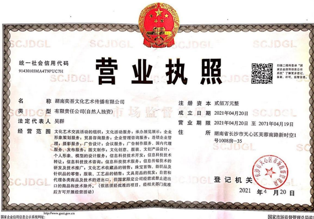
湖南奕吾文化艺术传播有限公司