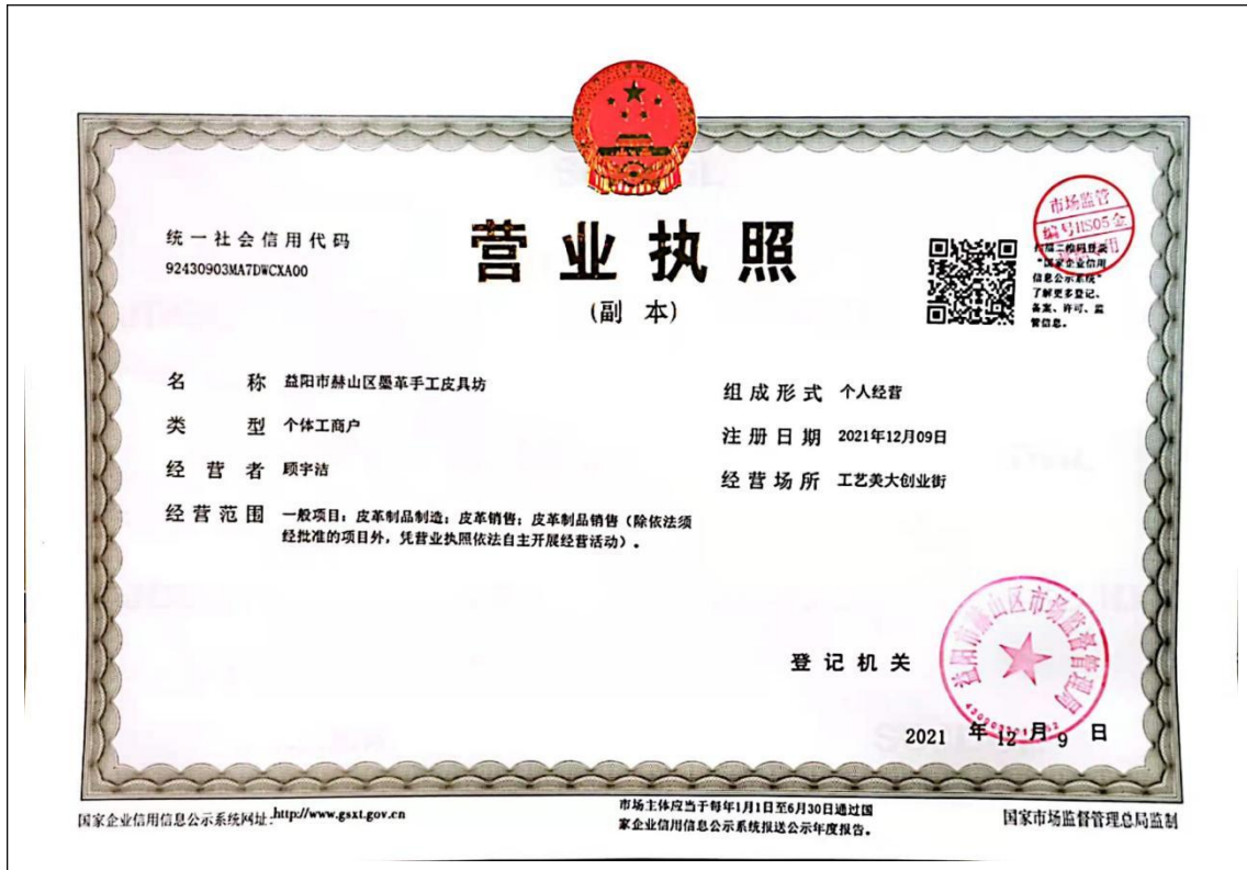
益阳市赫山区墨革手工皮具坊