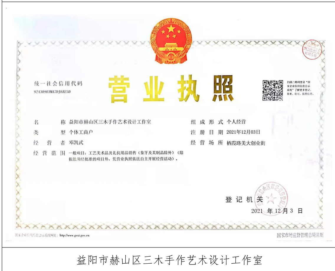
益阳市赫山区三木手作艺术设计工作室