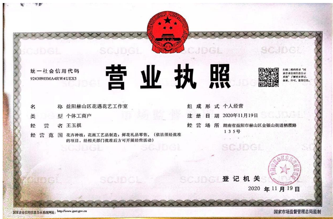
益阳赫山区花遇花艺工作室