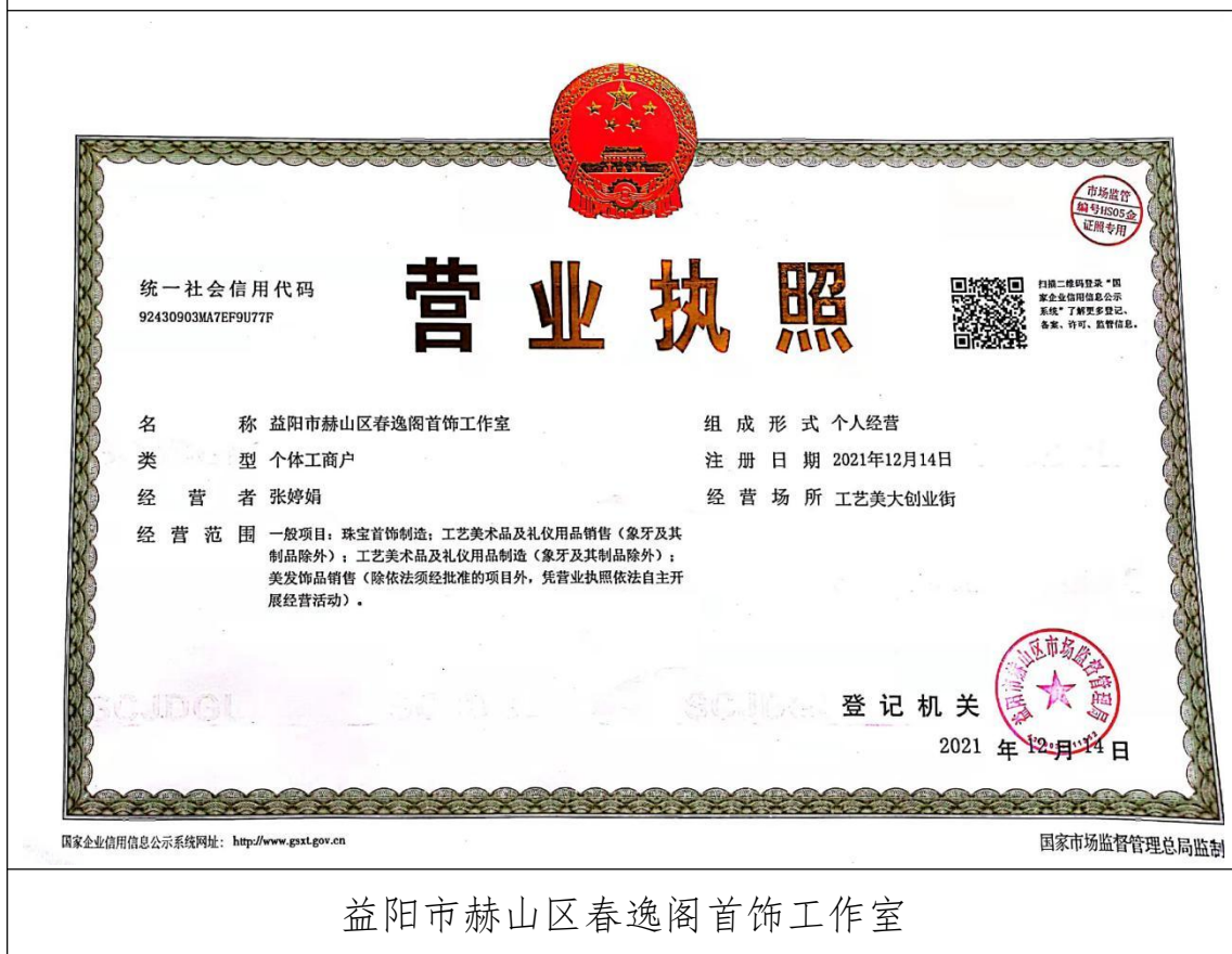
益阳市赫山区春逸阁首饰工作室