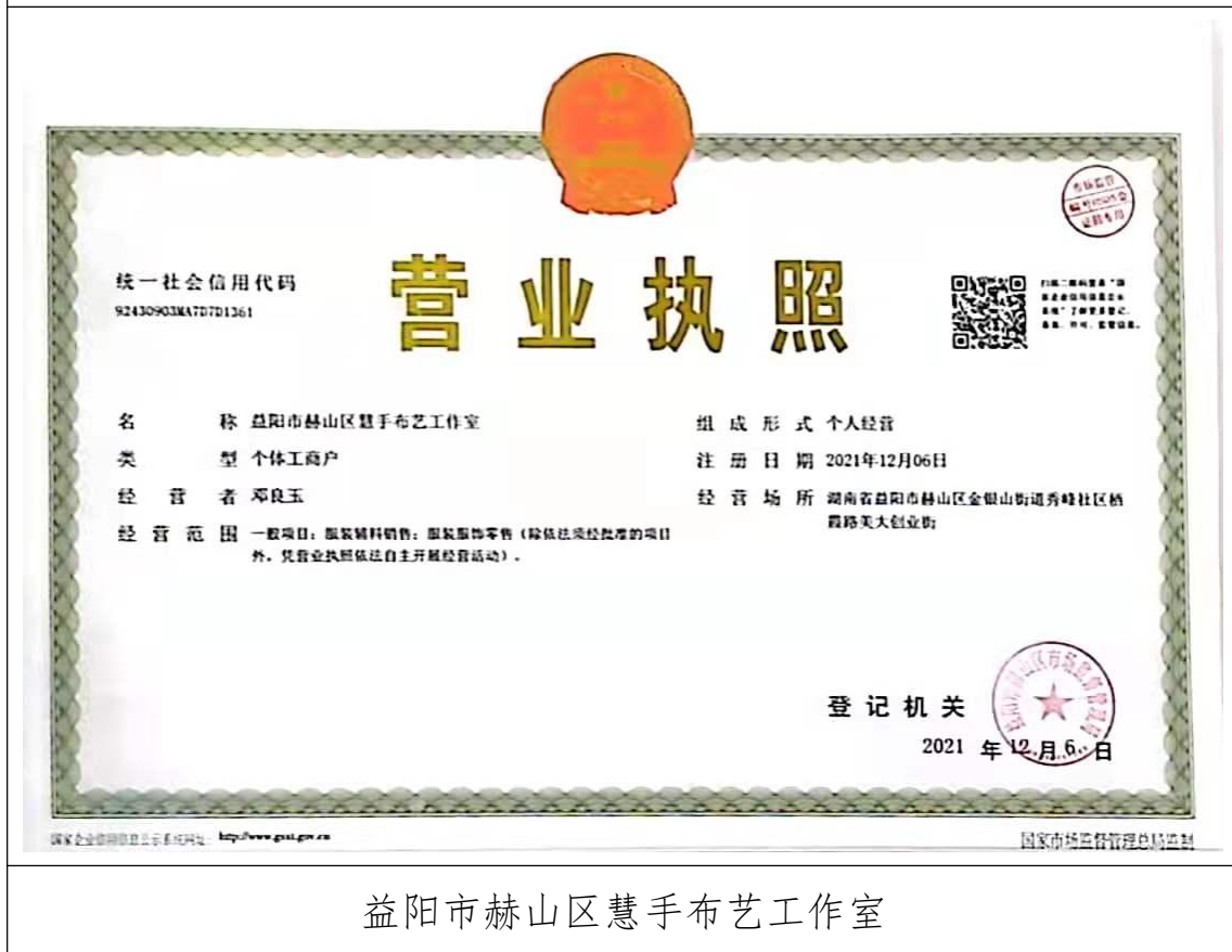
益阳市赫山区慧手布艺工作室