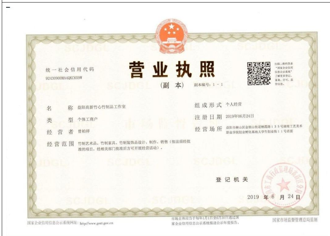
益阳高新竹心竹制品工作室