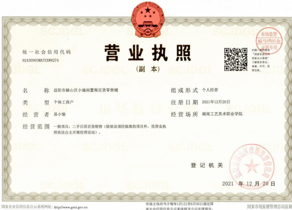
益阳市赫山区小瑜闲置百货零售铺