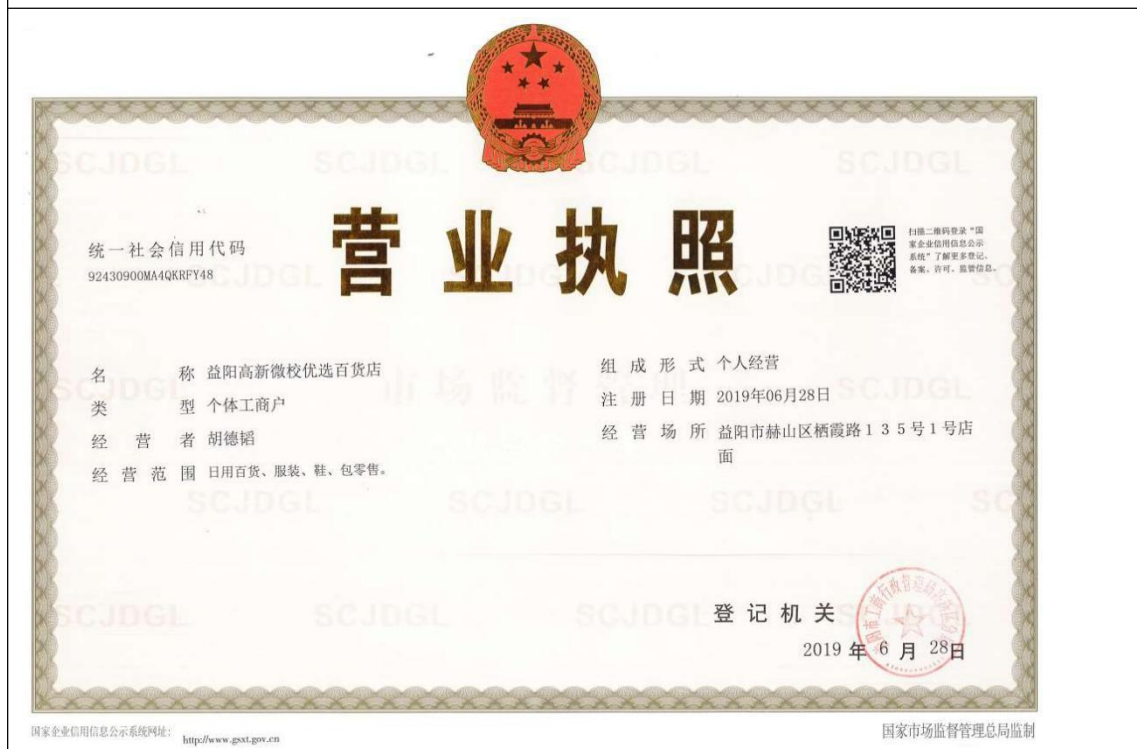
益阳高新微校优选百货店