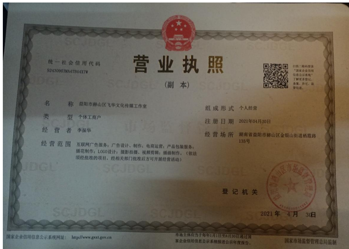
益阳赫山区飞华文化传媒工作室