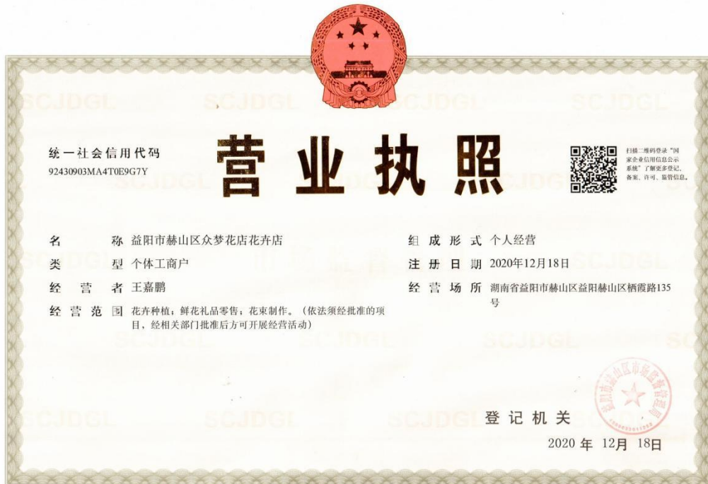
益阳市赫山区众梦花店花卉店