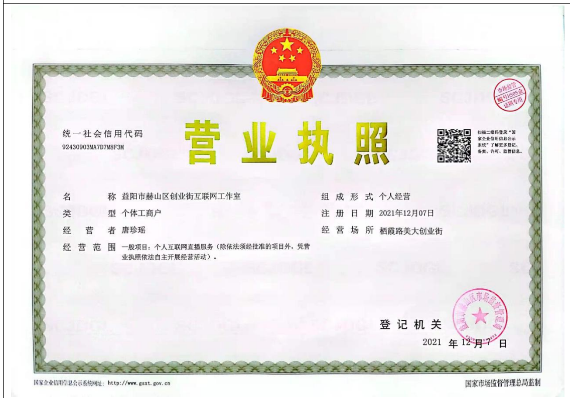
益阳市赫山区创业街互联网工作室