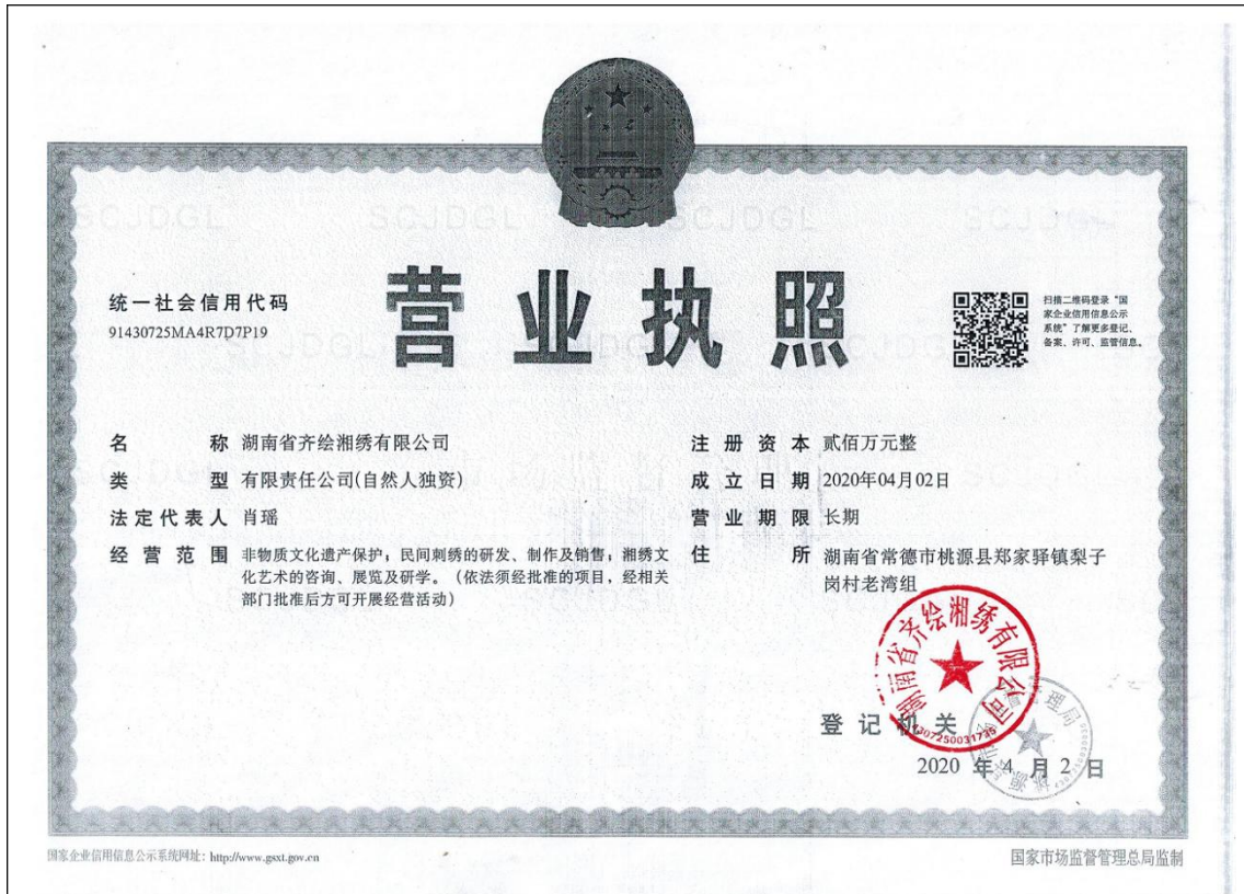
湖南省齐绘湘绣有限公司