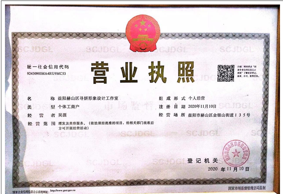
益阳赫山寻妍形象设计工作室