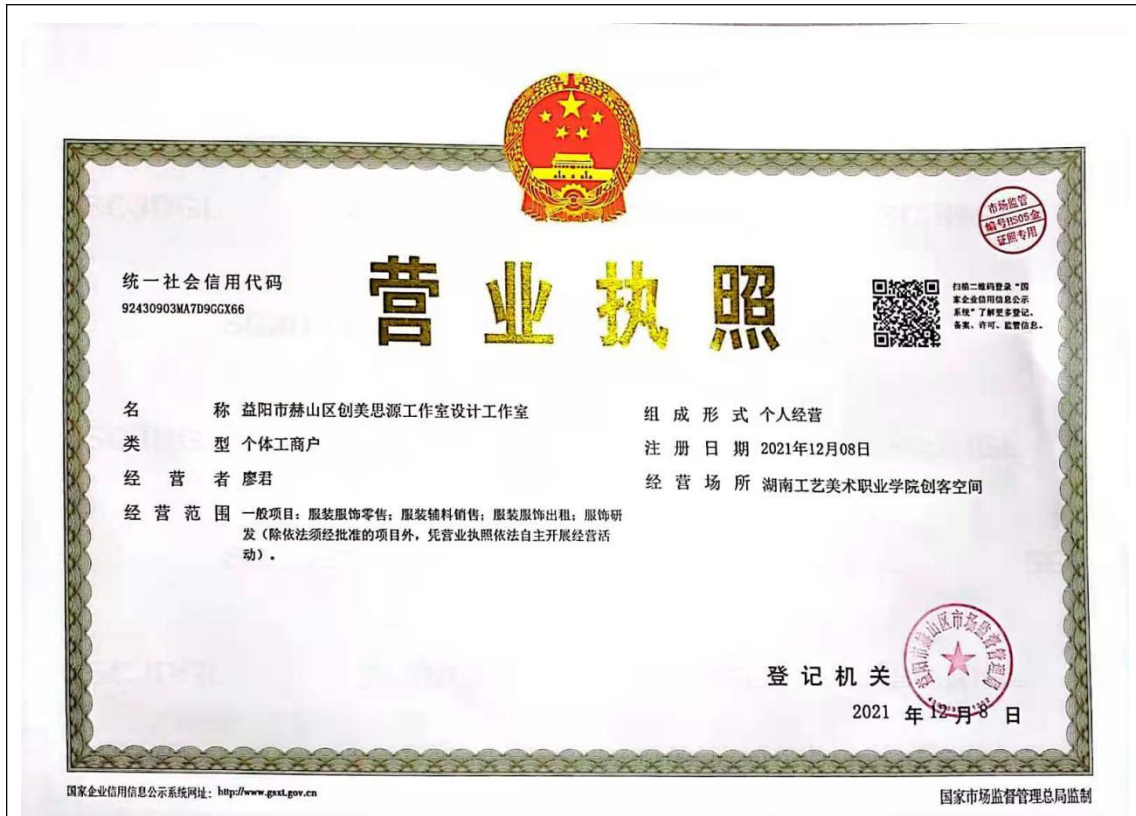
益阳市赫山区创美思源工作室设计工作室