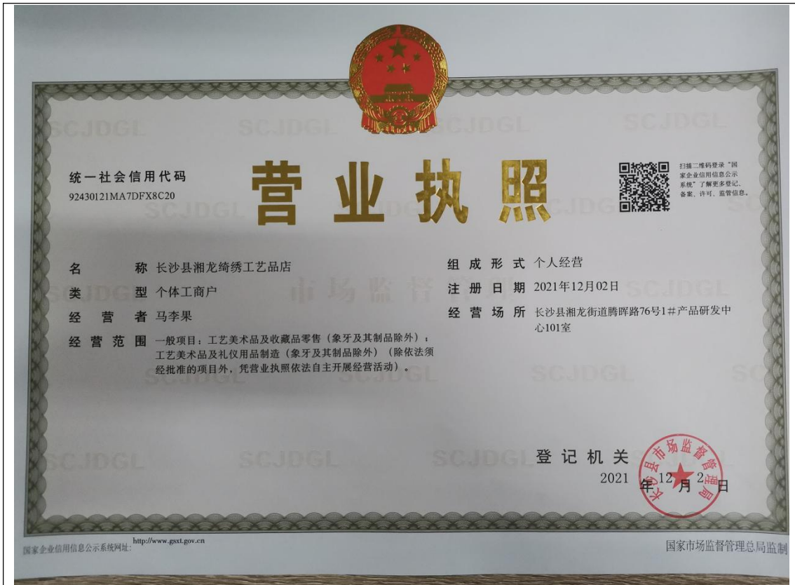
长沙县湘龙绮绣工艺品店