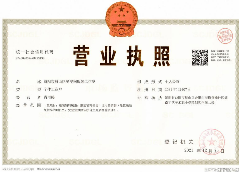
益阳市赫山区星空间服装工作室