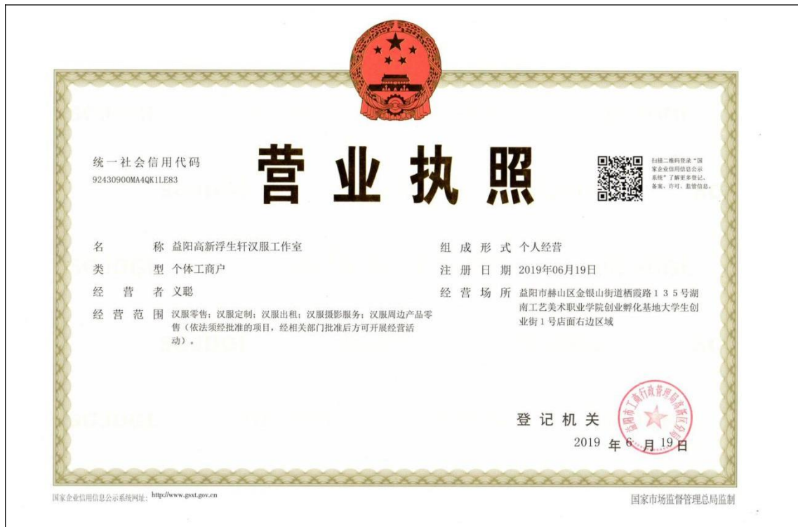
益阳高新浮生轩汉服工作室