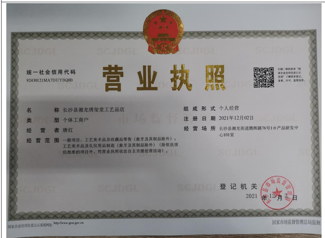
长沙县湘龙绣玺堂工艺品店