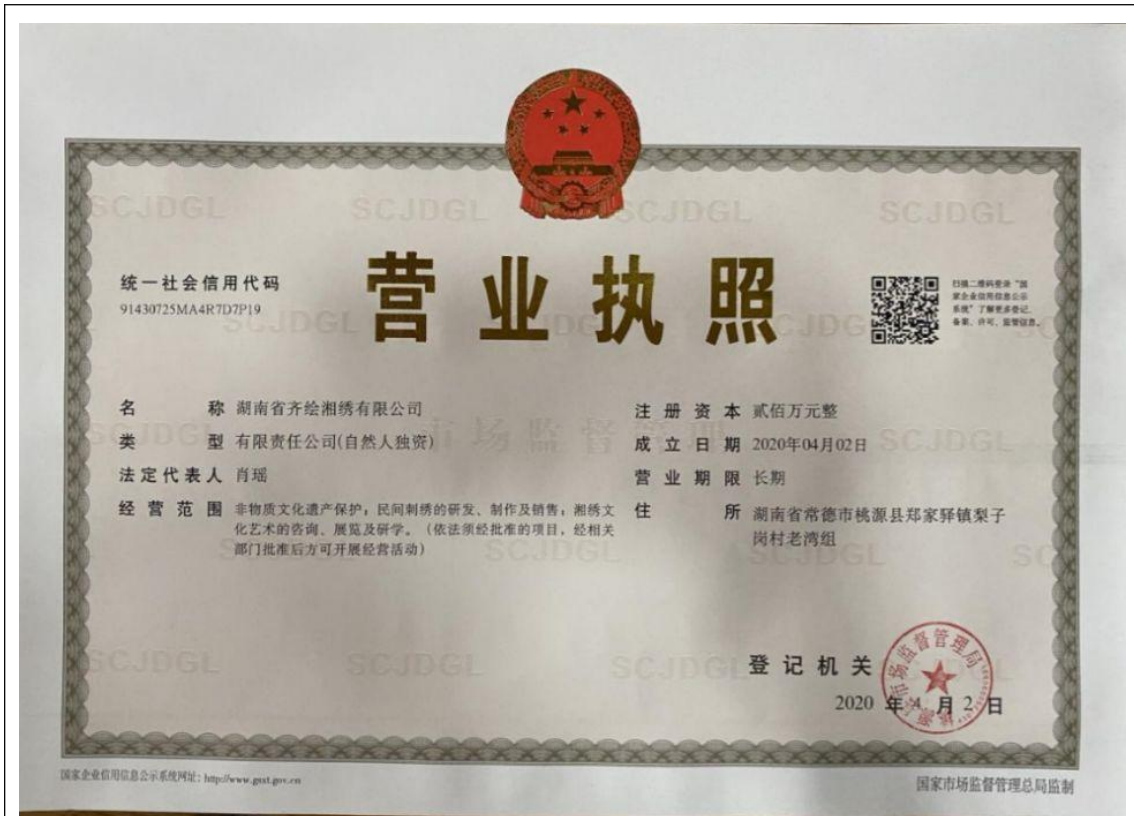
湖南省齐绘湘绣有限公司