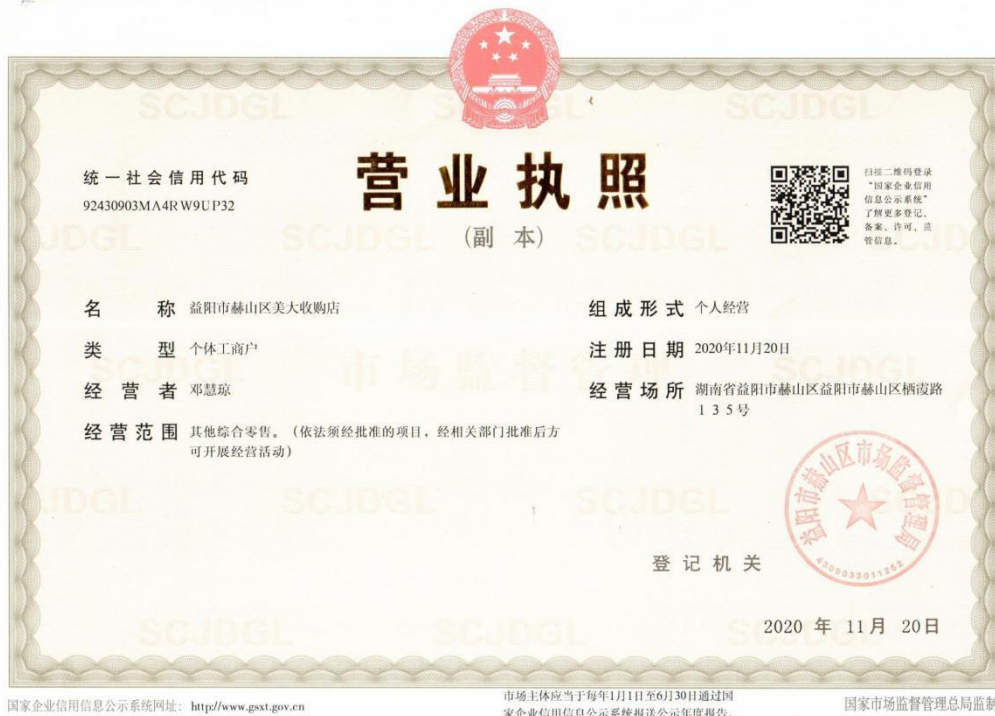
益阳市赫山区美大收购店