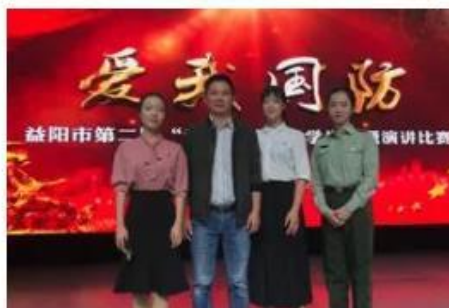
(指导学生参加各类比赛，多次在省级、市级比赛中获奖)