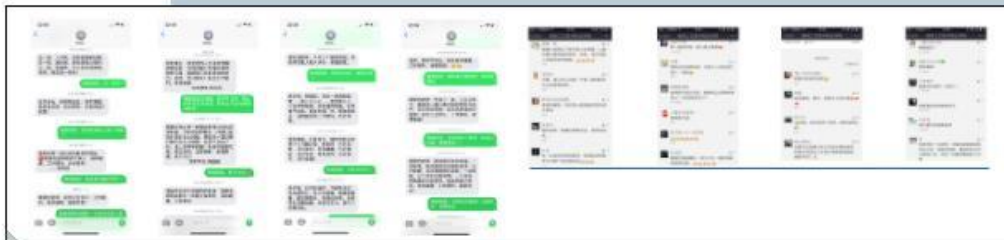
(某一学生连续四年的短信祝福和学生的留言、评价、学生的节日祝福)