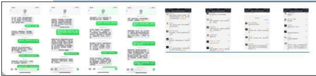
(某一学生连续四年的短信祝福和学生的留言、评价、学生的节日祝福)