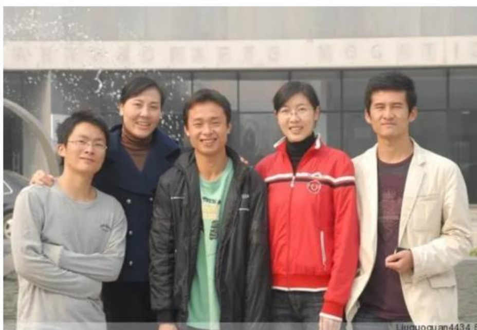
(第一届(2006级)学生至今仍保持联系)