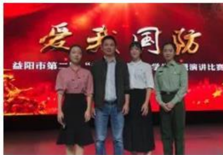
(指导学生参加各类比赛，多次在省级、市级比赛中获奖)