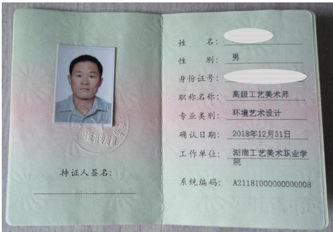
图 11 职称晋升证书