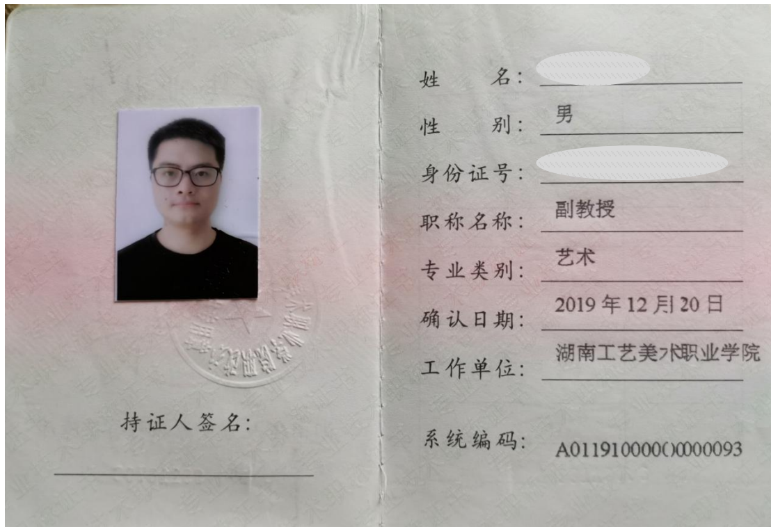
图 10 职称晋升证书