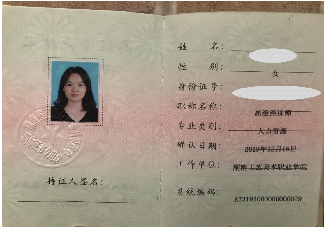
图 12 职称晋升证书