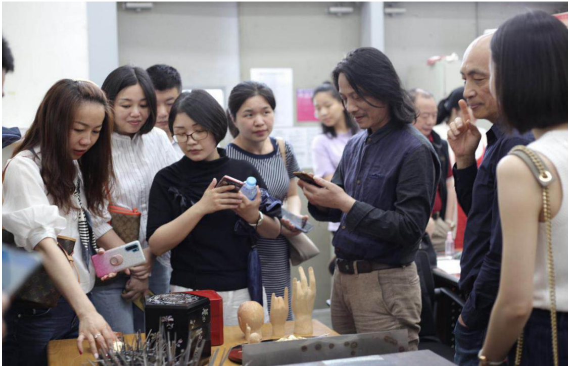
图3 研究韩国传统七宝工艺的老师们

课程设置贴合了湖南工艺美术职业学院前去交流的老师的专业。课后，在教授和助教的带领下，老师们对各个专业的实训室进行实地的考察和研究。