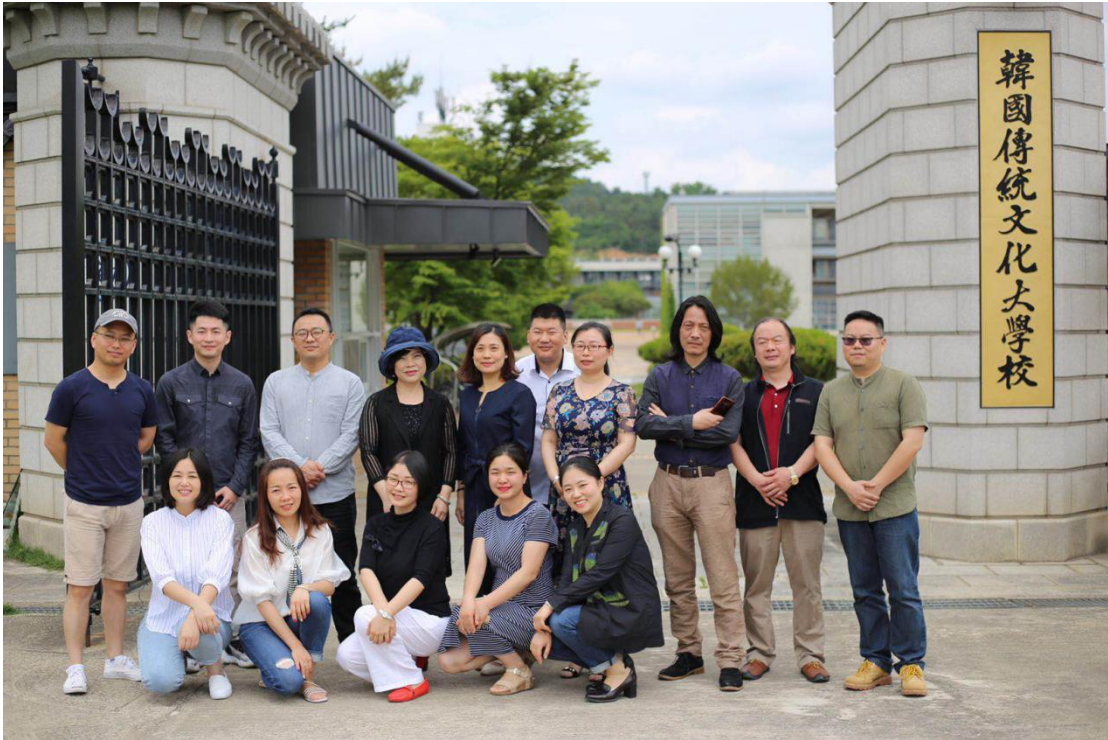
图 1 湖南工艺美术职业学院专业教师在韩国传统文化大学门口合影

韩国传统文化大学是由国家文化部直接拨款，对韩国传统工艺进行复兴的学校。校内设施完善，有专门的染料种植园、传统提花织机和纺织机、陶瓷传统烧制龙窑等一系列传统工艺的设备。