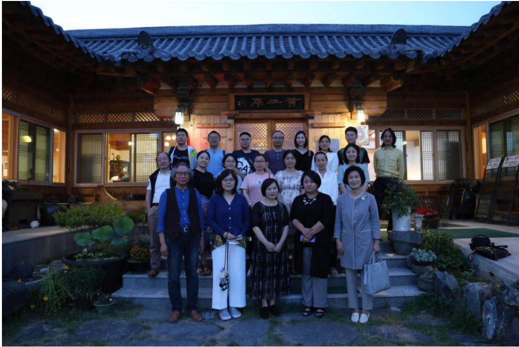
图5 晚宴后与授课教授们合影