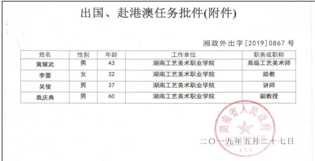
截图 4 关于专业群教师赴韩国学习、研修的湖南省人民政府出国、赴港澳任务批件（附件）