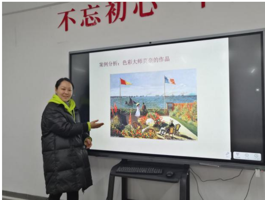
教师实施模块化教学

模块按某种方法组装起来，成为一个整体，完成整个系统所要求的功能。增强了师生间互动关系，突出了因材施教，因此学生获得感与课程作品质量较之以前明显提升。