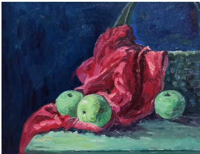
湘绣 2002 班学生完成的作品