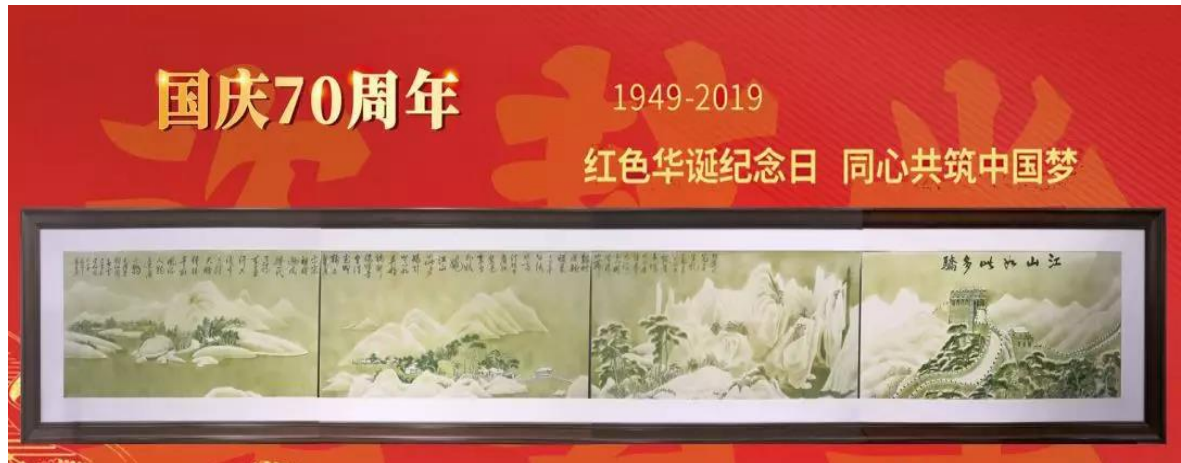
中国工艺美术大师黄永平创新研发作品《江山如此多娇》长卷瓷板画