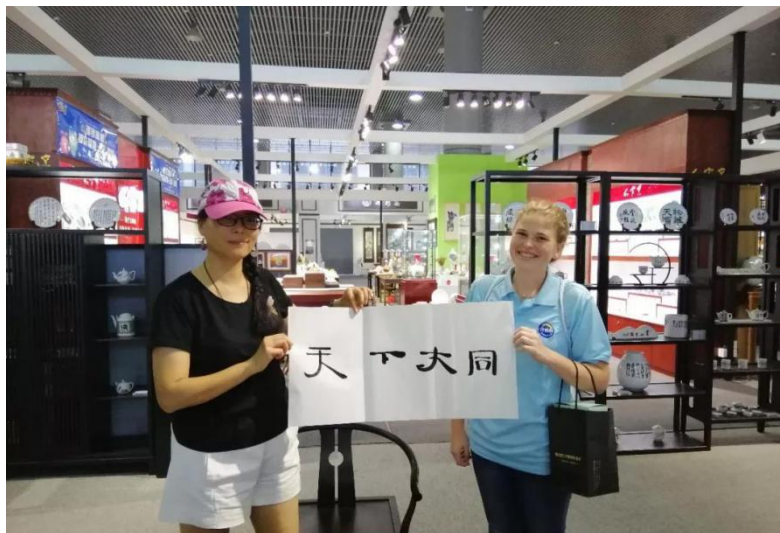
积极开展国际交流与合作