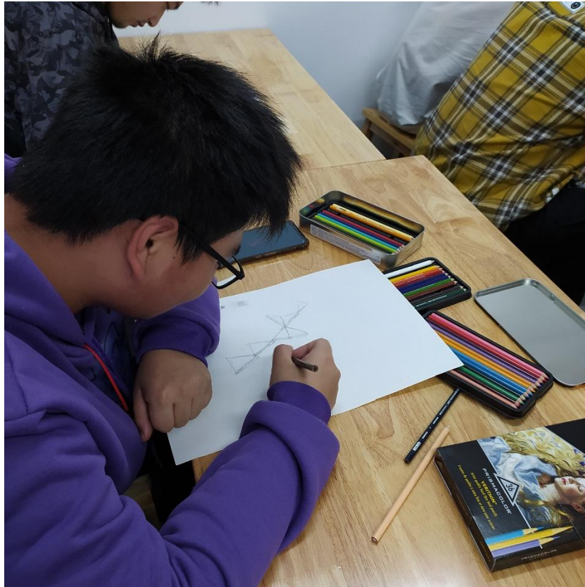
(二) 基础实训室 230