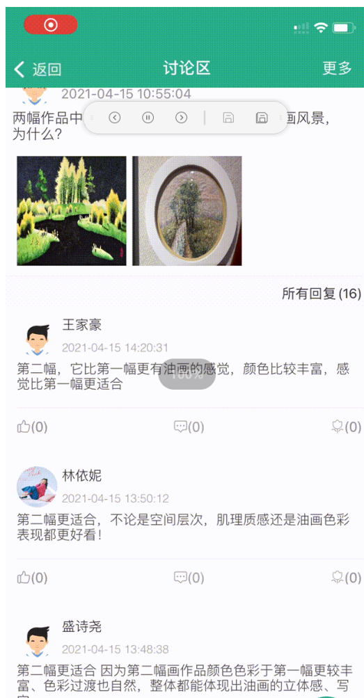
在智慧教室运用信息化教学手段开展课堂讨论