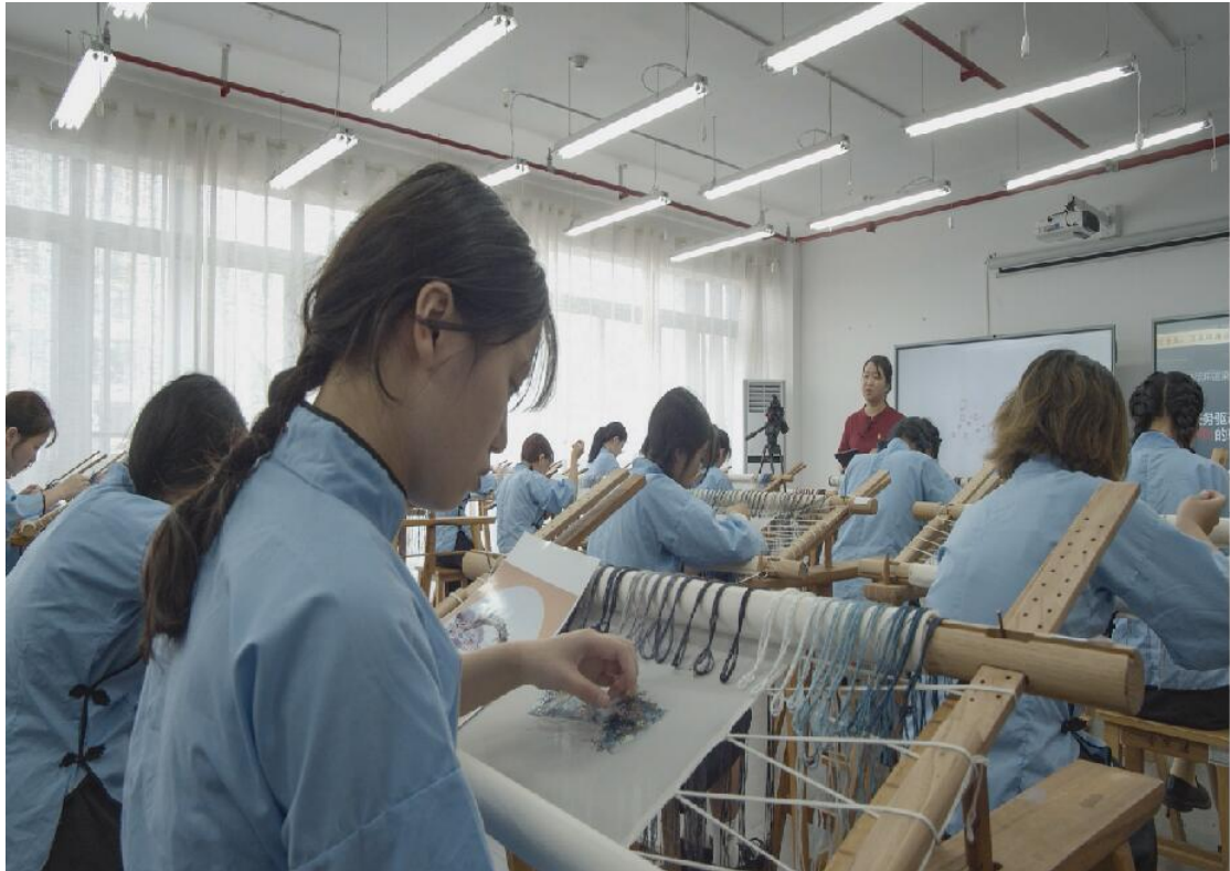
运用智慧教室录制湖南省“楚怡杯”职业院校教学能力比赛视频