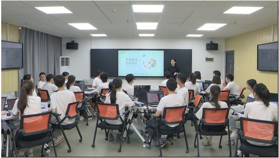
设计方向专业课教师运用智慧教室进行教学