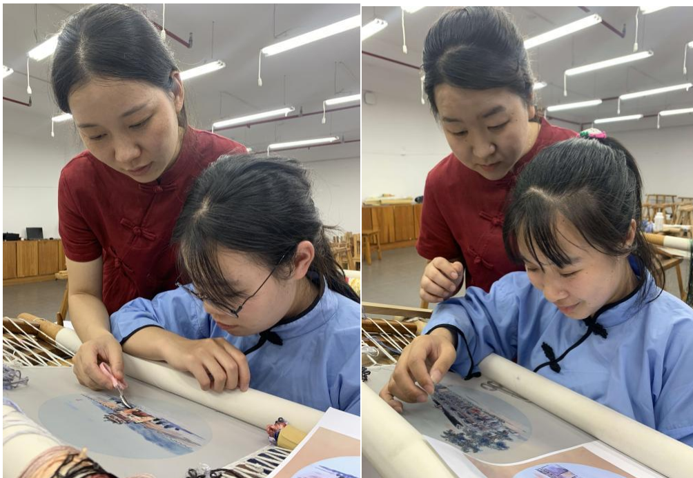
工艺教师在智慧教室现场指导学生绣制风景作品