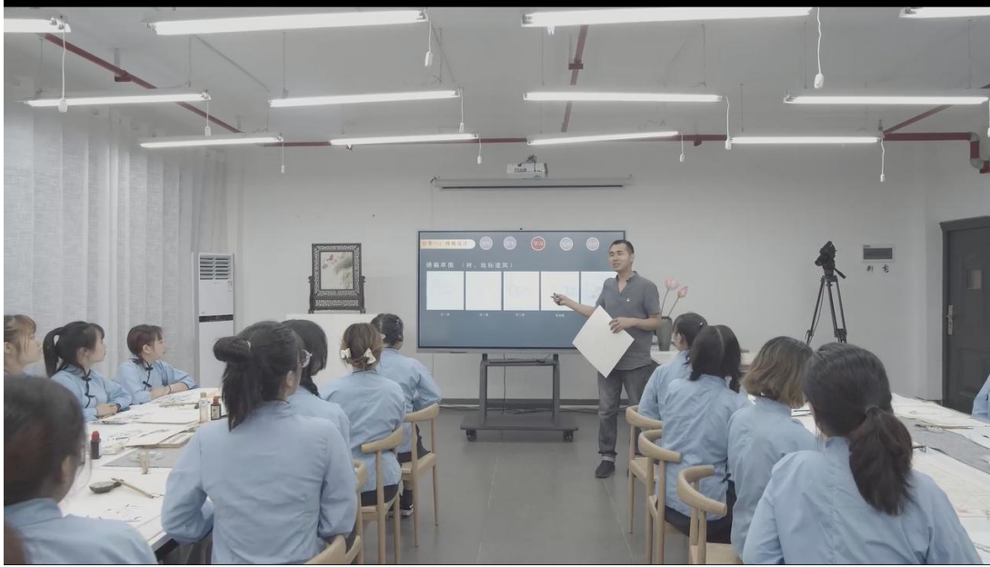
《创意绣稿设计》任课教师运用智慧教室进行教学