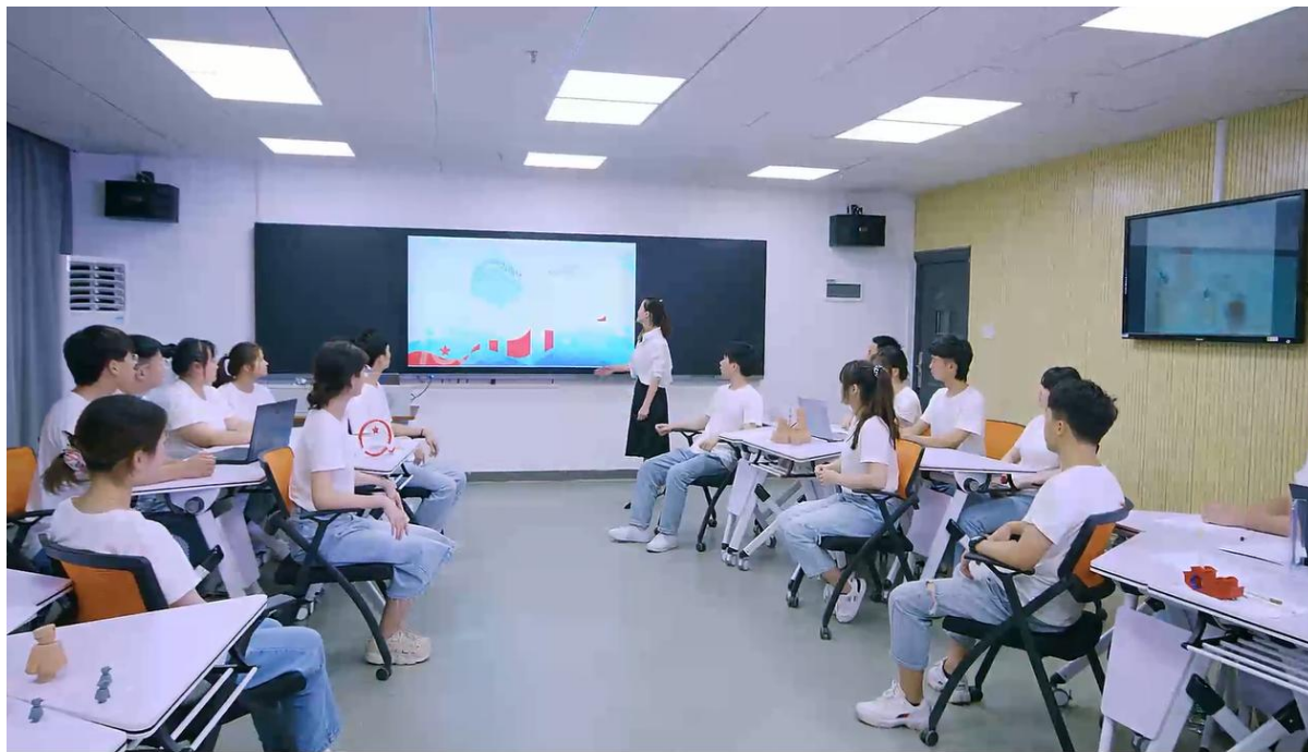
湘绣营销课教师运用智慧教室进行教学