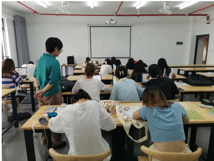
首饰设计与工艺专业学生在智慧教室进行首饰设计