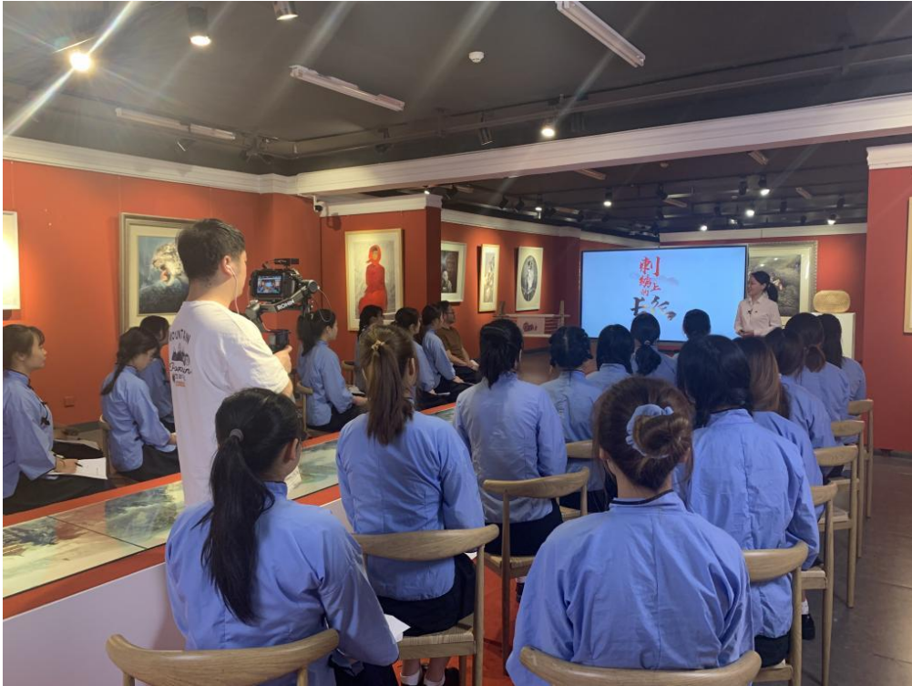
运用智慧教室开展油画绣稿设计教学