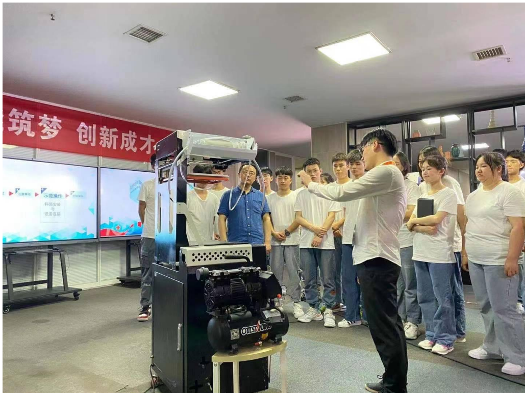
陶瓷设计与工艺专业在智慧教室开展教学，现场演示 3D 打印示范教学