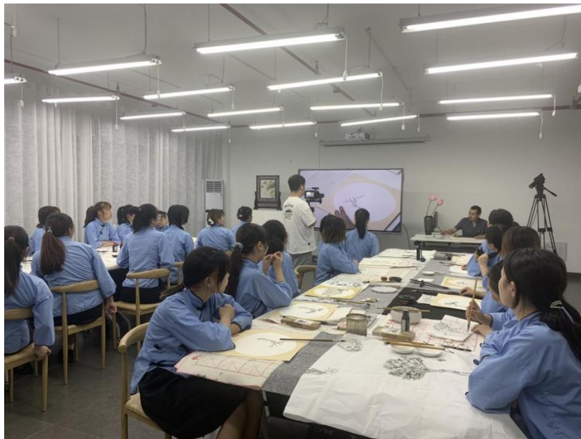
运用智慧教室开展写意绣稿设计教学