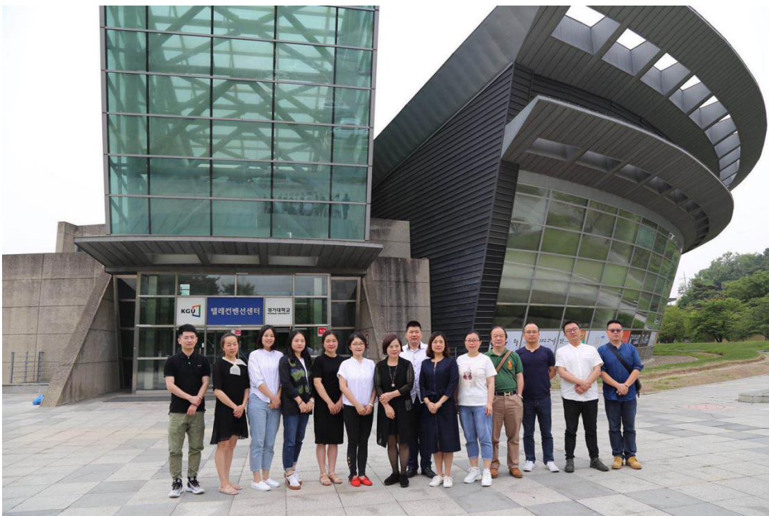
在京畿道大学图书馆前合影

此次将京畿道大学列为参访学校,是因为为了培养具有竞争力的全球性人才,促进国际教育与研究的发展,京畿大学已经与中国、美国、俄罗斯、日本等 38 个国家的 220 所大学有签订了姊妹大学协议,是一所具有国际视野的开放包容的大学。同时,为了外国留学生的生活便利,设立了两栋 22 层的现代化男、女宿舍楼(2人1室)。在首都圈内的语言学院中性价比比较高的语言学院。为了迈进首都圈大学以及全国前 10 位大学之列,京畿大学校正在尽全力努力改善。