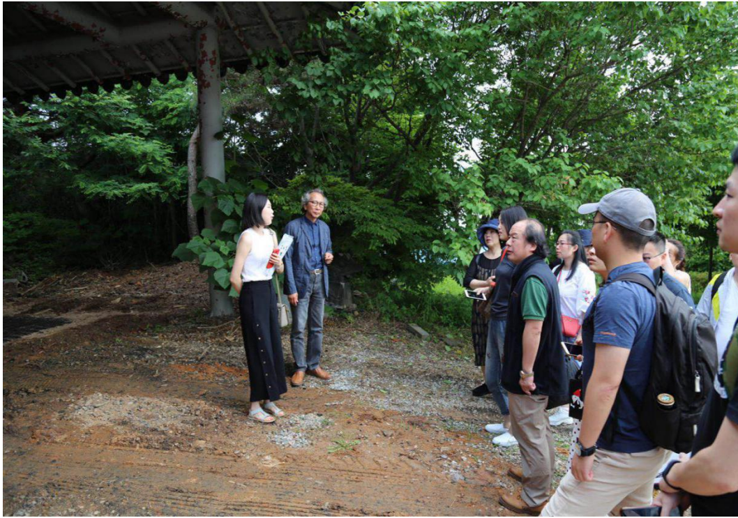
参观校内陶瓷烧制龙窑

此外，在助教的带领下，老师们还参观了校内保留并部分重新建造的韩国传统建筑。在与校方的晚宴上，研修团老师们表示在这两天的课程中都收获颇丰，纷纷与自己专业相关的教授畅所欲言，讨论中韩两国文化之间的联结与差异，并对进一步的合作与交流表示了期待。