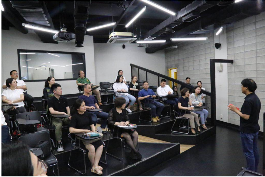
老师们听取校方介绍韩国综合艺术大学情况

本次参访的是位于石串校区的影像院，包含有动画制作等与湖南工艺美术学院相贴合的专业。