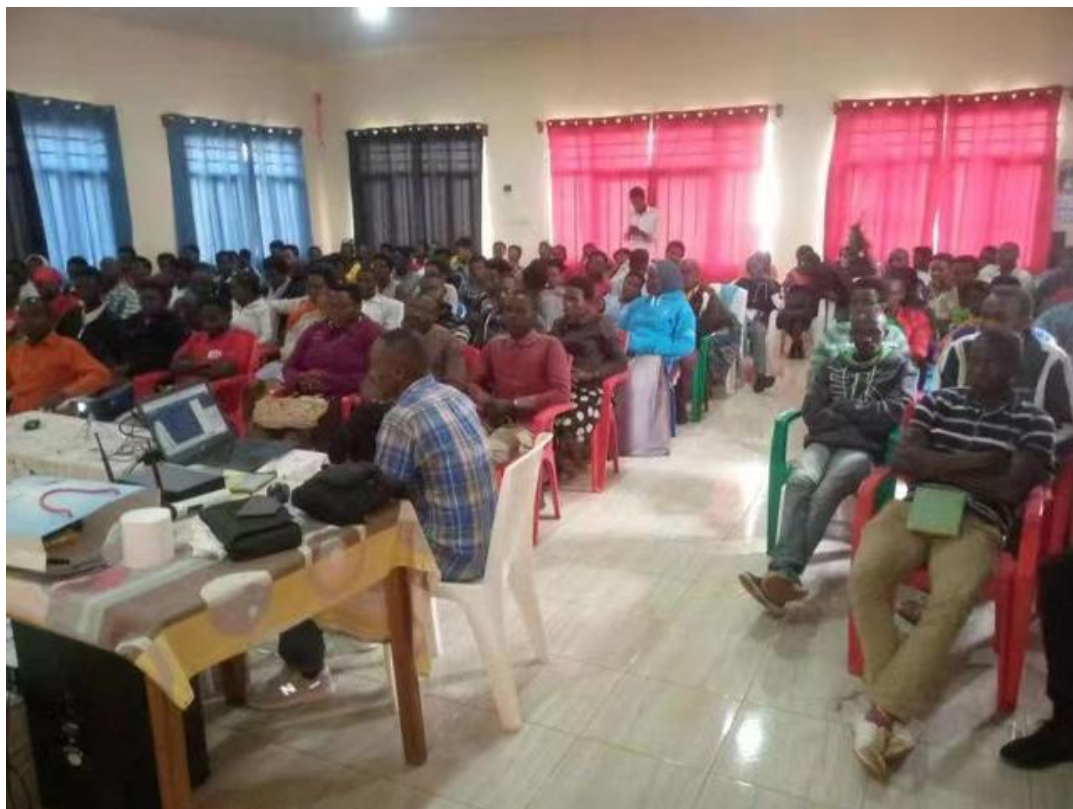
外籍学生国外收看现场