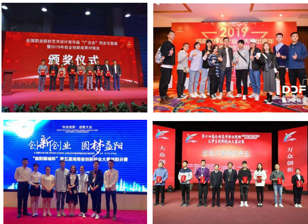
图 73-76 学徒生在各类专业竞赛、创新创业竞赛中屡获佳绩

培养过程与企业生产过程对接，学生（学徒）毕业（出师）后，即为企业熟练员工。试点班 20 名学徒生，校级技能抽查合格率达 100%，优秀率达 65%；职业综合素养测试合格率 100%，优秀率 85%；公司中层领导对古建修复设计、古建修复工程管理、古建修复工艺三类岗位学徒生跟刚实习的满意率分别为 95 %、100 %、100%。60%学生在本年度学习期内获得校级以上各类奖励，有 9 名学生在校级以上竞赛中获得，其中有 2 名学生获国家级奖项，有 5 名学生获公司“年度优秀员工”称号；有 3 名学徒生获校级以上奖学金；有 3 名学徒生光荣入党，有 1 名学徒生被评为优秀党员。