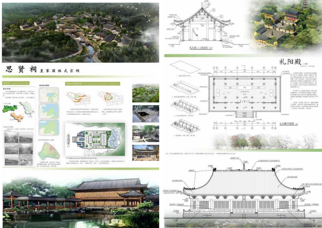
图 55-56 学徒生优秀设计作品