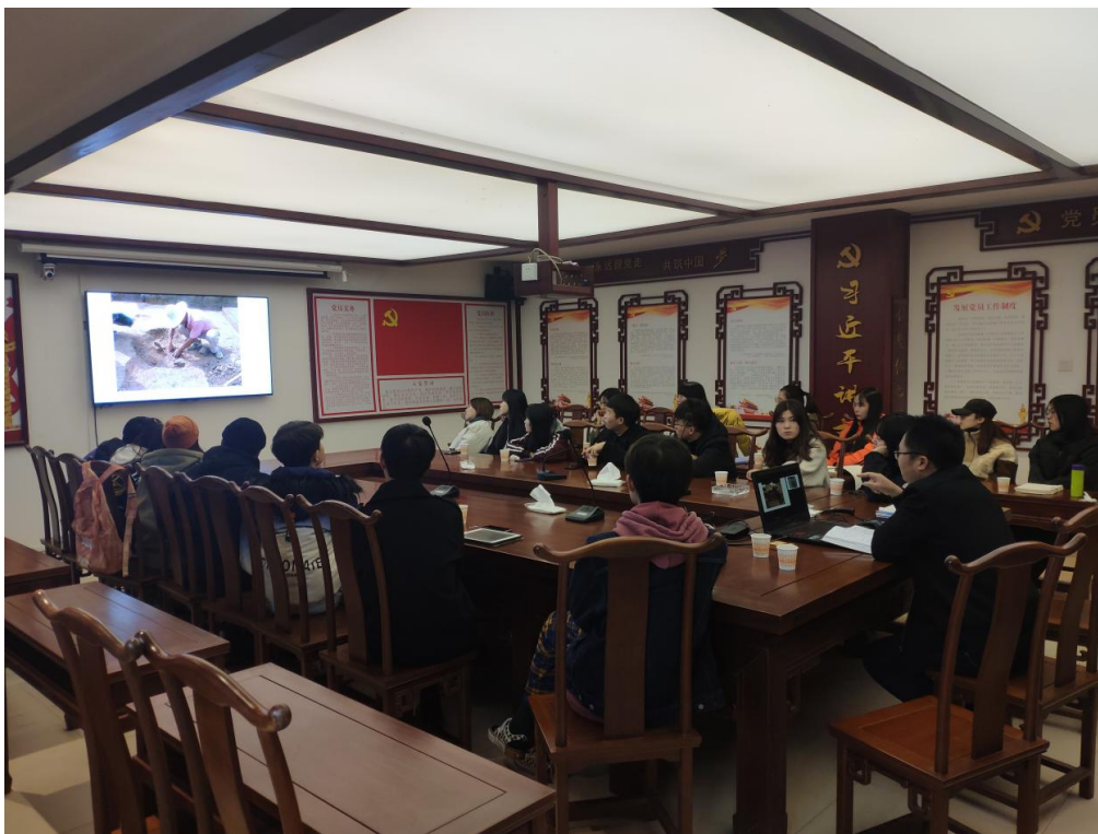
图 13 学徒生在公司总部集中学习古建修复工艺知识