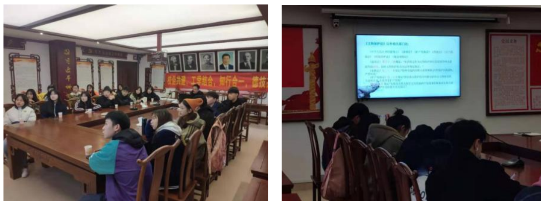
图 69-70 现代学徒制试点班公司本部实训教学规范有序进行

3.构建了多方参与的质量评价体系。 通过标准引领，以学徒生学到的职业知识、掌握的职业技能与具备的职业素养为主要评价方面，以学生（学徒）学到的职业知识、掌握的职业技能与具备的职业素养为主要内容，对学生（学徒）在课堂学习、顶岗实习、实训、生产等