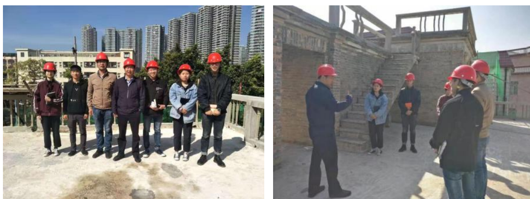
图 67-68 现代学徒制试点班跟岗实习现场教学规范有序进行