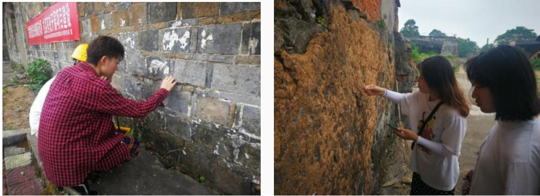
图 51-52 学徒生徐凌霞、刘忠显、龙景琪、胡鹏正在开展工艺实践