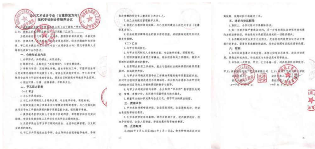
图1 公共艺术设计专业（古建修复方向）现代学徒制校企合作培养协议

1.校企协同育人机制有效构建。 在公共艺术设计专业（古建修复方向）现代学徒制试点专家指导委员会”（专委会）的指导下，公司与湖南工艺美术职业学院共同落实《公共艺术设计专业（古建修复方向）现代学徒制校企合作培养协议》《公共艺术设计（古建修复方向）2018级人才培养方案》，学校承担校内文化课、专业知识学习和技能训练，企业负责岗位模块课程技能训练和顶岗实习，依托“双主体+双导师+双基地”“三双”现代学徒制工学交替人才培养模式改革，校企双方进一步明确责任，分工协作，补齐短板，现代学徒制教学运行状况良好。校企双方以企业岗位工作标准为依据，共同构建了学徒生“项目考评+过程测评+成果互评”的专业课程考核评价体系，双方导师共同开展教学质量考核评价，完善了共育共管、多元评价的“双主体”协同育人机制，提高了人才培养质量水平。