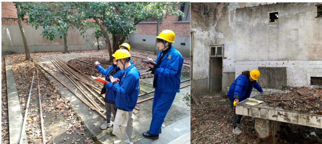
图 16-17 古建修复工程管理岗学徒生在四方山项目部进行现场勘察