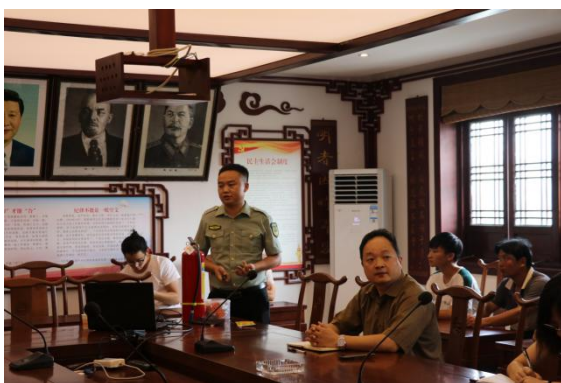
图 57 公司组织消防官兵为师生开展消防安全教育培训

1.修订了现代学徒制学徒生管理办法。贯彻以生为本的管理理念，校企共同修订了《公共艺术设计专业（古建修复方向）学徒生管理办法》，对学徒生的日常行为、个人品德、岗位职责、任务完成、劳动薪酬、保险保障等各方面进行了进一步优化完善，确保学徒生学业的顺利进行。