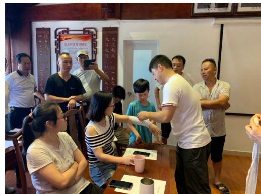
图 58 公司组织医疗专家为师生开展应急救援专项培训