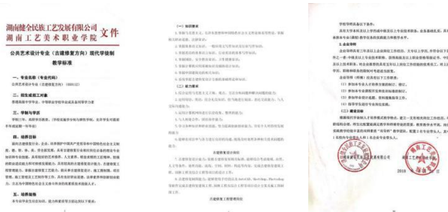
图 23-25 公共艺术设计专业（古建筑修复方向）现代学徒制专业教学标准