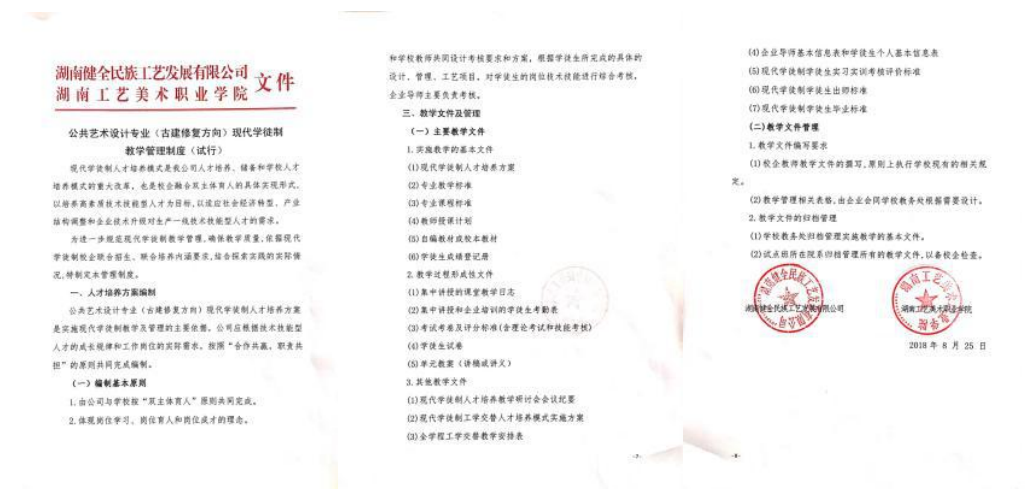
图 59-61 公共艺术设计专业（古建修复方向）现代学徒制教学管理制度

2.健全了现代学徒制教学管理系列制度。制定和完善了《公共艺术设计专业（古建修复方向）现代学徒制教学管理办法》和《公共艺术设计专业（古建修复方向）现代学徒制学徒生学分制与弹性学制管理办法》，对课堂教学的组织形式、听课评课、教学过程性文件要求以及学徒生的学制（含弹性学制）、学分、选课、考核等方面做出了具体的规定，确保了教学有序进行。