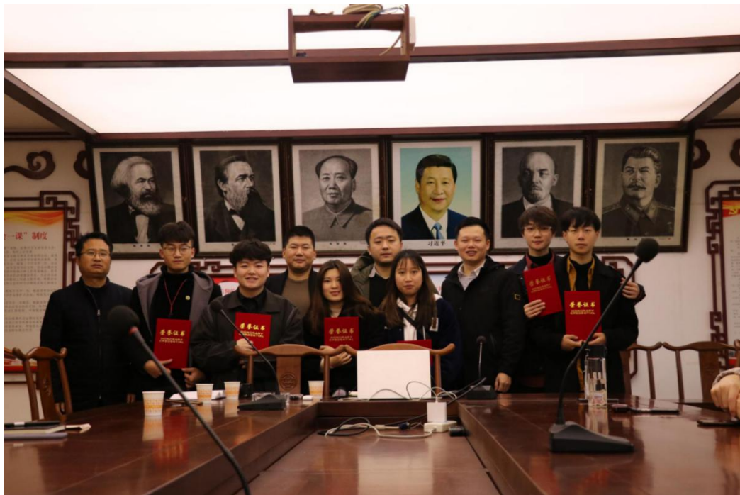
图 18-19 2019 年度公司优秀员工（学徒生）合影