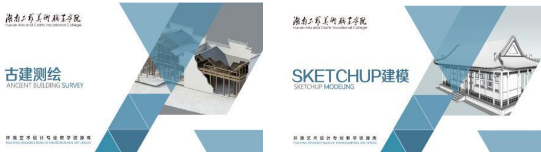
图 39-42 《手绘表现技法》等 6 门网络课程