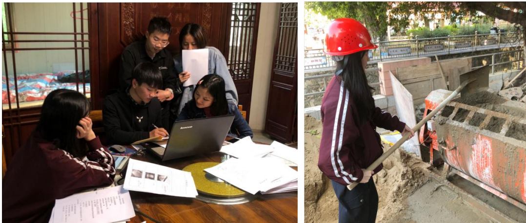
图 53-54 广东项目部同学正在进行工程管理项目实践