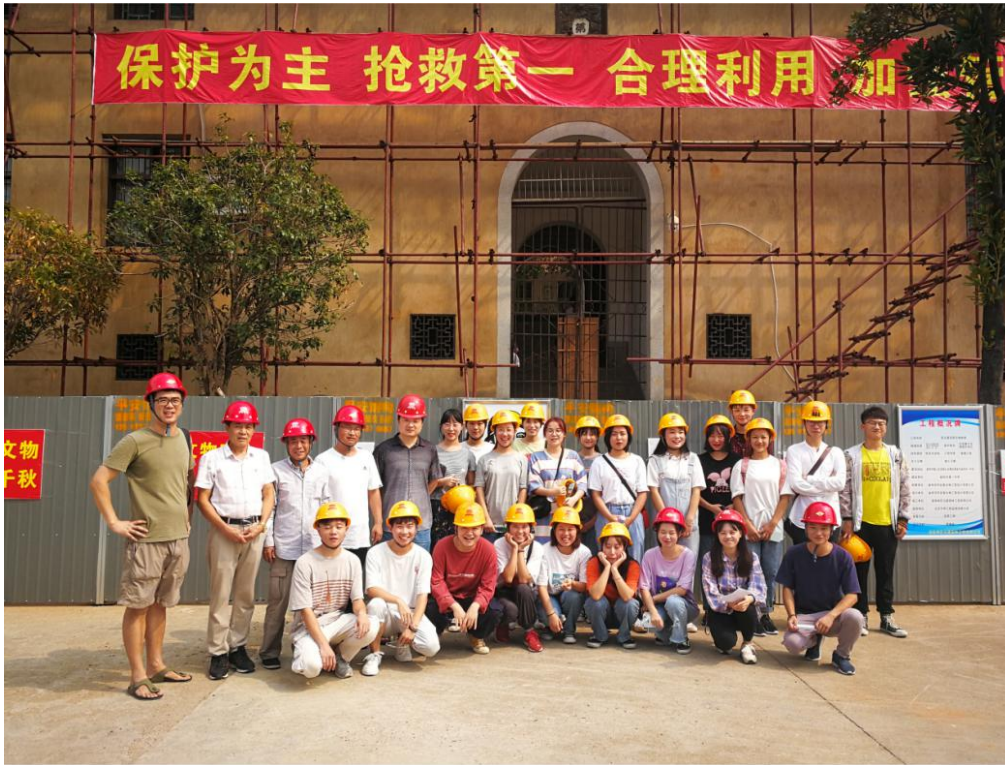
图 83-85 2018 级公共艺术设计专业（古建修复方向）师生在项目现场合影