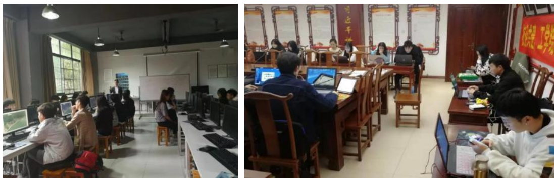
图 45-46 学徒生分别在学校和公司进行“分段递进式”式学习