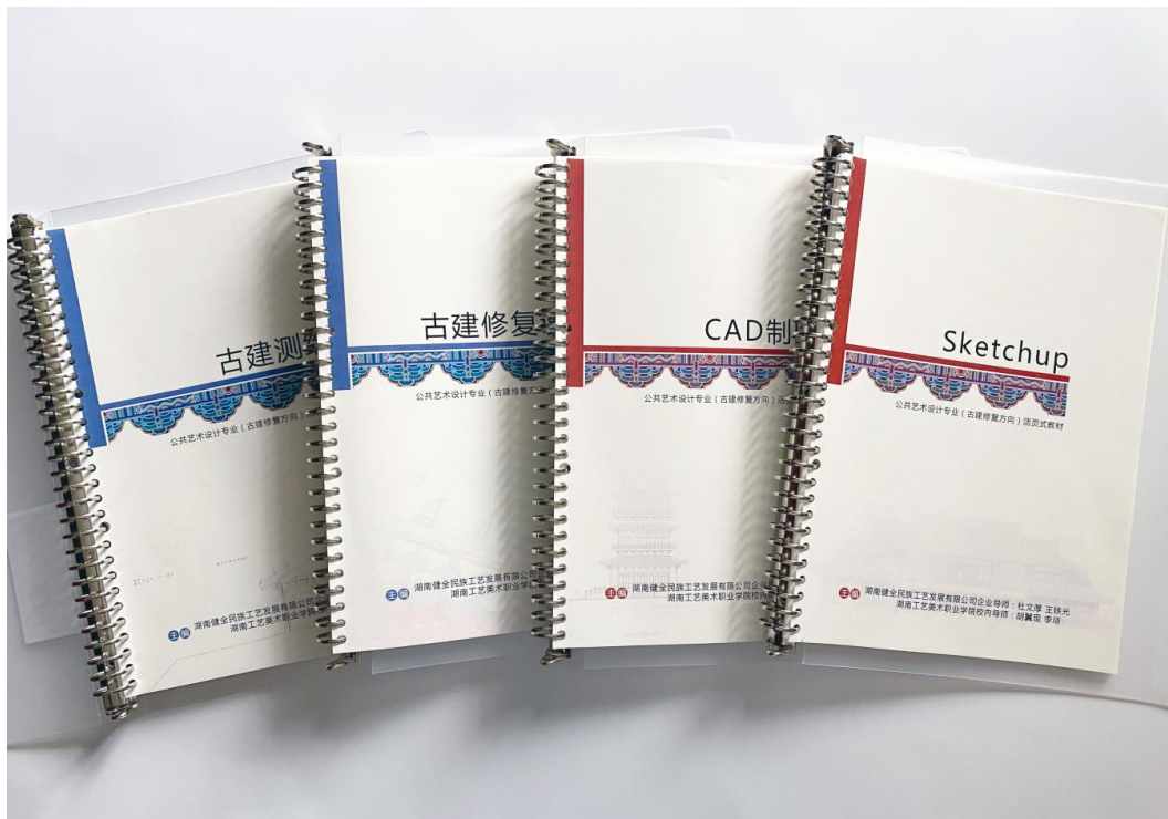
图 43 《古建筑测绘》等 4 本活页式教材