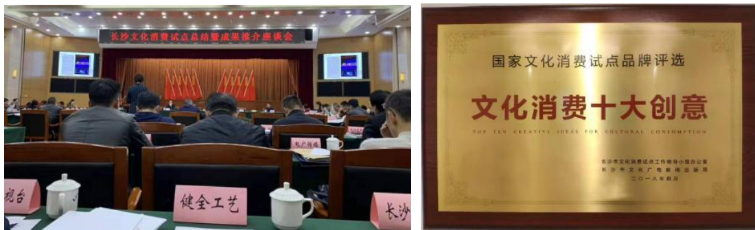
图 81-82 校企双方共同参加长沙市文化消费试点暨成果推荐总结会

三是学徒生在现代学徒制培养中加快了成长。一方面，现代学徒制为学徒生成长提供了“肥沃土壤”。学徒生充分享受校企两方面的教学资源，我公司专门开辟了“工艺教学车间”，其生产基地、科研基地为学徒生提供了真实的学习环境。另一方面，现代学徒制成为学徒生成长提供了“引路人”。公司选派了一批优秀古建修复工匠担任学徒生导师，引导学徒生快速成长为优秀工匠人才。