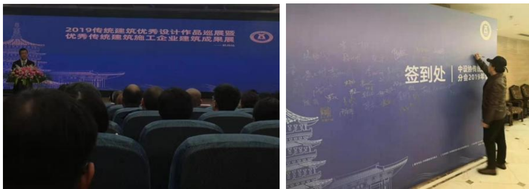
图 30-31 校企双方共同参加合作开发项目成果展