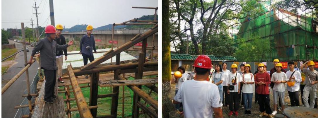
图 49-50 企业工程部导师唐德明、杜文厚为学徒生现场授课