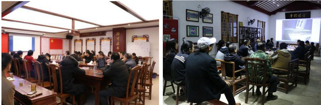
图 10-11 古建数字资源用于公司员工培训

在校企双方充分研讨的基础上，校企双方充分发挥了各自组织架构、资金、场地、设备、技术及其它资源优势，共同制定了《现代学徒制教学资源建设与应用管理办法》，确保资源建设工作持续有序推进，实现资源建设进一步“共建、共管、共享”。