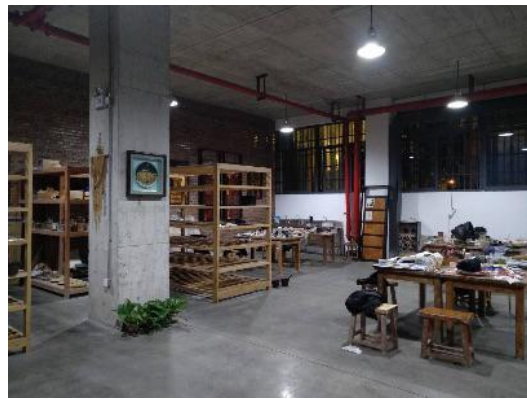
图 38 漆工修复工艺实训室

2.教学资源建设有序推进。 在已建成的校企合作课程资源基础上，校企以省级精品在线开放课程为建设标准，共同建成了《Photoshop》《Sketchup 建模》《建筑构造设计基础》《古建施工图制图与识图》《手绘表现技法》《古建测绘》6 门在线开放课程；完成了《古建测绘》《古建修复设计》《CAD 制图》《Sketchup》4 本活页式教材的开发工作。