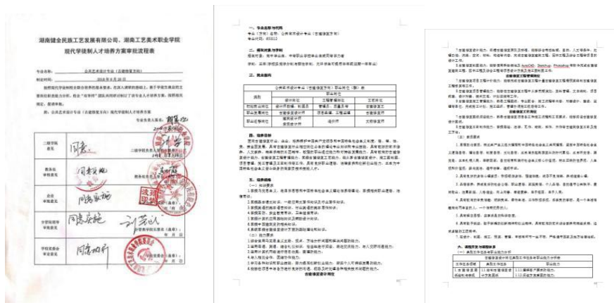
图 20-22 公共艺术设计专业（古建筑修复方向）现代学徒制人才培养方案

1.健全了专业教学标准体系。校企共同分析研究古建筑修复设计、古建筑修复工程管理、古建筑修复工艺三个岗位的人才职业素养要求，结合试点项目经验，共同修订了公共艺术设计（古建筑修复方向）专业教学标准和人才培养方案；共同开发了《Sketchup》《古建筑施工图制图与识图》《古建筑修复设计系列岗位课程》《古建筑修复工程管理系列岗位课程》《古建筑修复工艺系列岗位课程》等14门适配岗位核心内容的专业（核心）课程标准；校企共同开发公共艺术设计（古建筑修复方向）专业技能抽查标准与题库，形成了与本专业现代学徒制人才培养相适配、较为完备的专业教学标准体系。