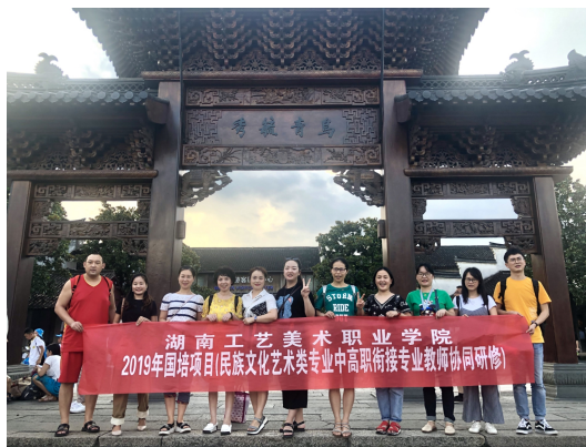
2019年在中国昆曲博物馆、张正根雕馆，民间瓦当陈列馆参观学习