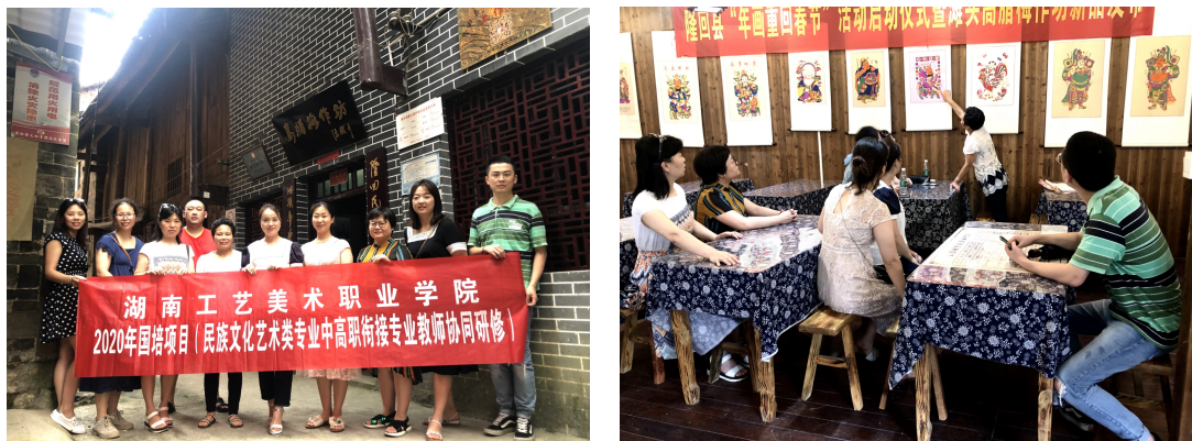
2020年学员在隆回滩头年画高腊梅工作室参观学习

返岗实践固化培训成果 每个学员结合自己的实际教育教学情况制定个人在岗实践计划，返岗后，在其任职学校开展或参与“上好一次公开课”活动 12 人次、教研教改研讨交流活动 18 人次、课题研究 11 人次、修订人才培养方案 9 人次、修订课程标准 12 人次，在“教中学”，“教中研”，有效提升培训成效，充分发挥岗位示范带动作用。