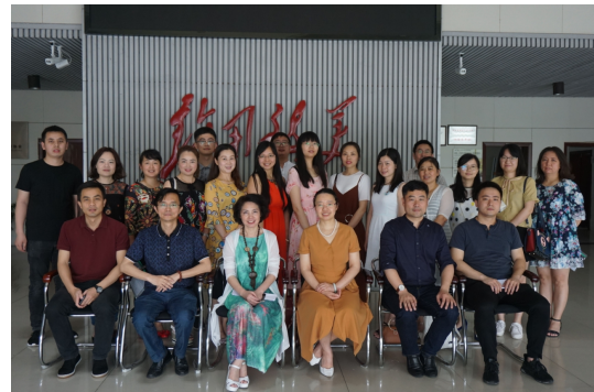
开班典礼现场照片

集中面授提高教改研能力 由职教理论专家和教学名师组成培训讲师团，采用集中辅导、小组学习、研讨展示等形式完成。集中面授课程分中高职衔接专业建设、教育教学方法改革、民族文化艺术类专业课程三大模块。每个集中面授阶段安排专家讲座，以“共生”“转型”“文化”为主题，围绕民族文化艺术类专业中高职贯通的人才培养方案定位、专业建设衔接、当代职业教育新理念等设计专题讲座24场，引领学员提升了教育教学理念。