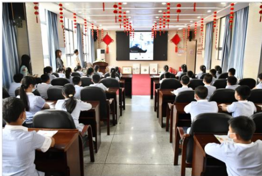
观看纪录片《非遗里的清廉》

为弘扬中华优秀传统文化，推进湘绣的传承和发展，6月13日，湖南工艺美术职业学院湘绣艺术学院走进长沙市雨花区长塘里第三小学，开展以“传承湘绣文化，绣出精巧‘廉’花”为主题的湘绣文化传播活动。