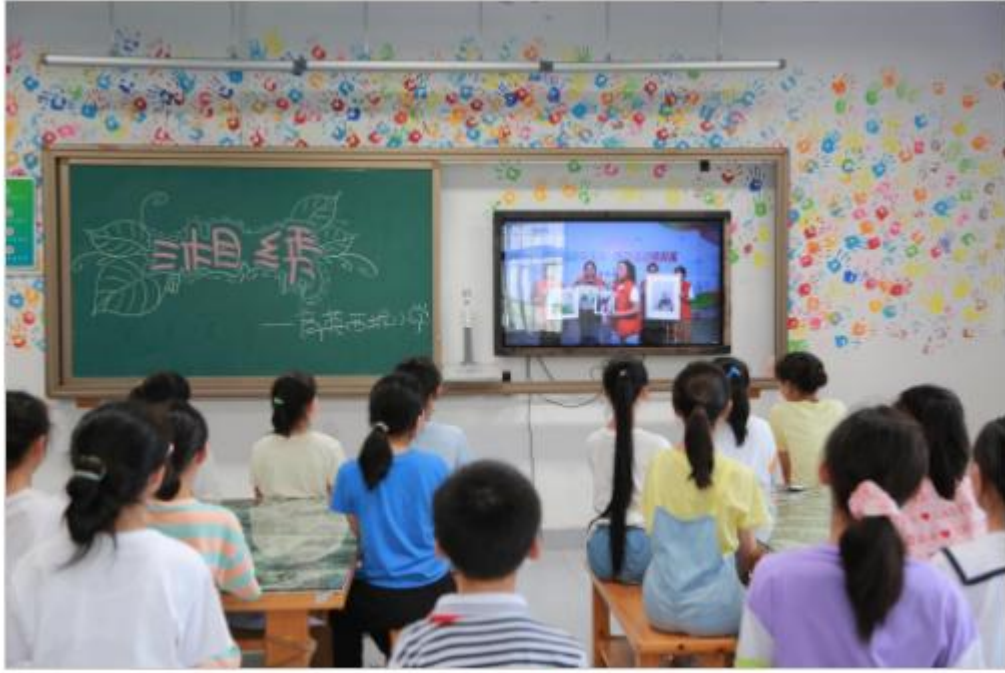
育英西城小学组织全校集中观看