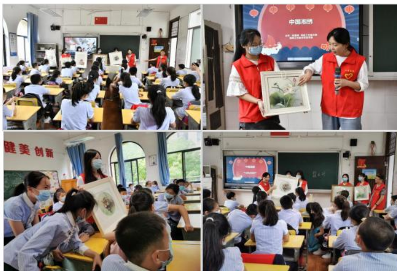
展示湘绣代表作品