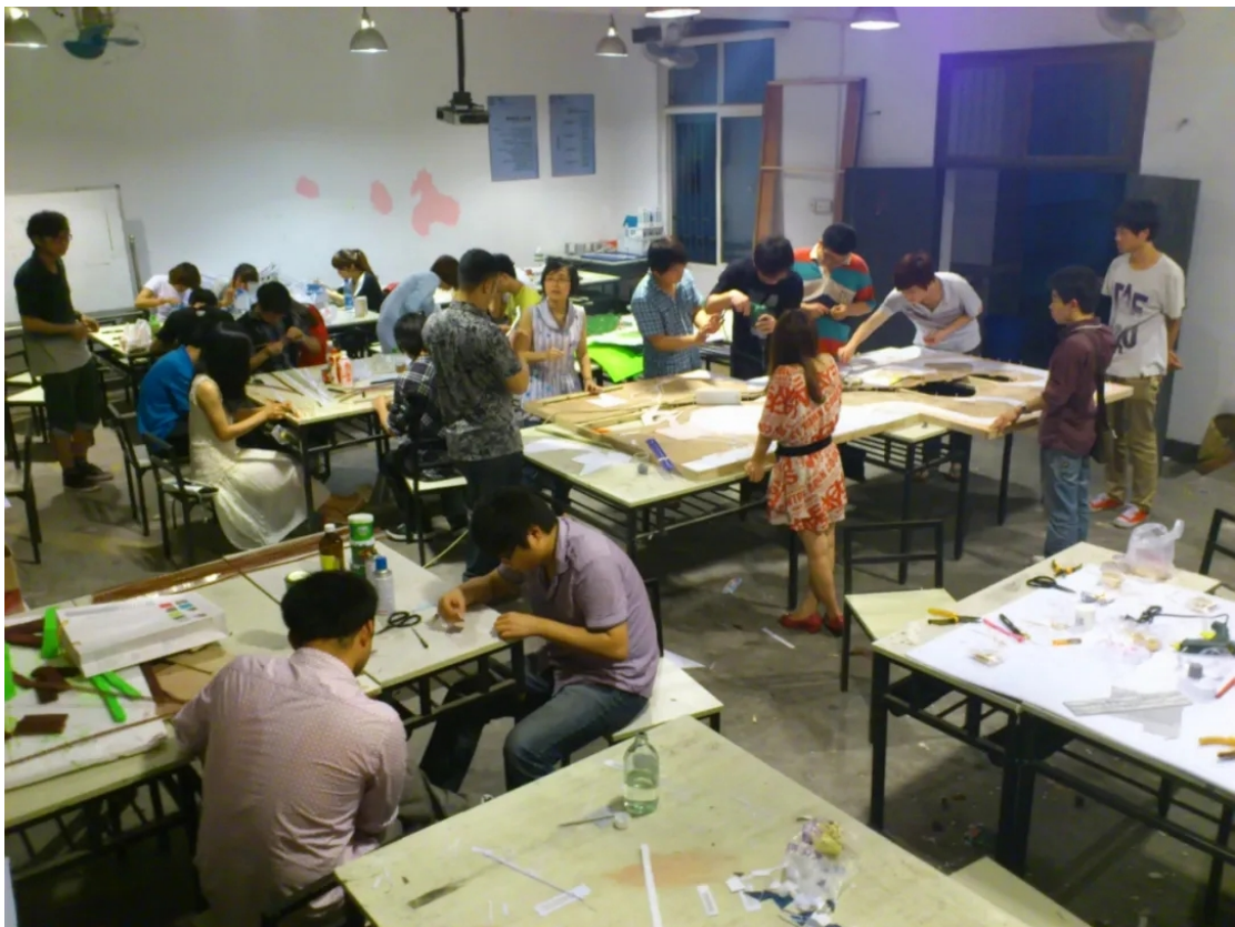
指导学生专业实践