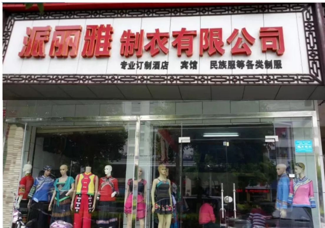
派丽雅制衣有限公司门市部（2016年5月）