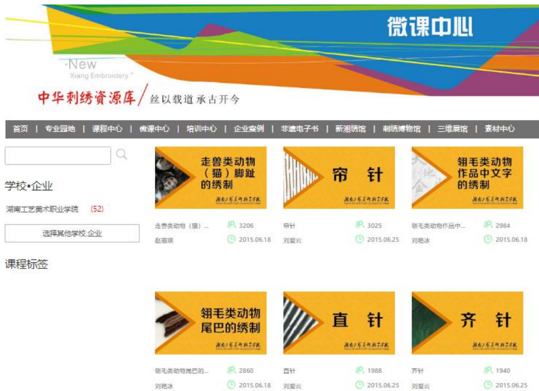
微课中心建设情况