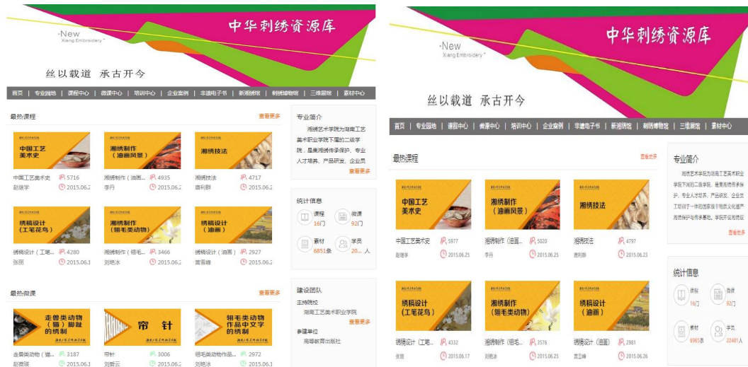
2020 和 2021 对比图网站首页

https://www.icve.com.cn/portalproject/themes/default/uz6eacgkzpnizkuk-ysalw/sta_page/index.html?projectId=uz6eacgkzpnizkuk-ysalw