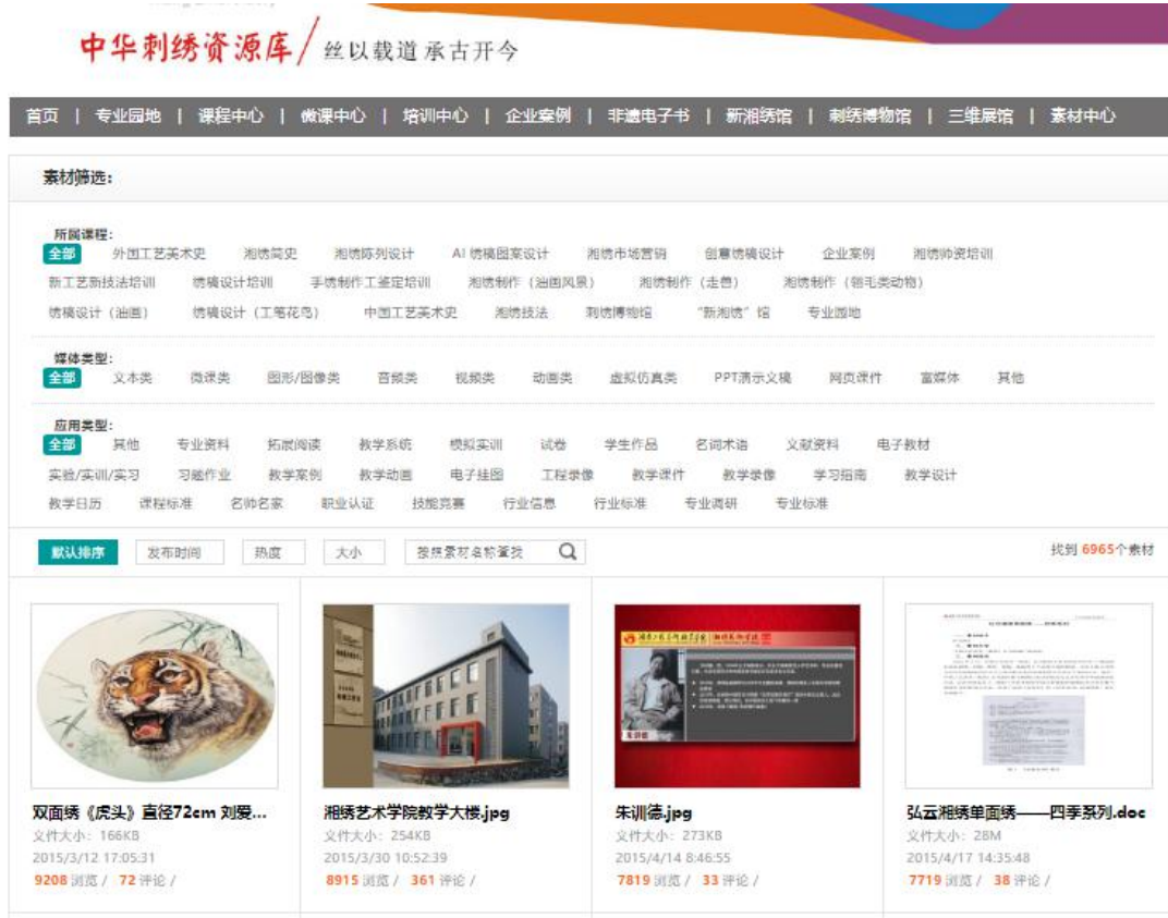
素材中心建设情况