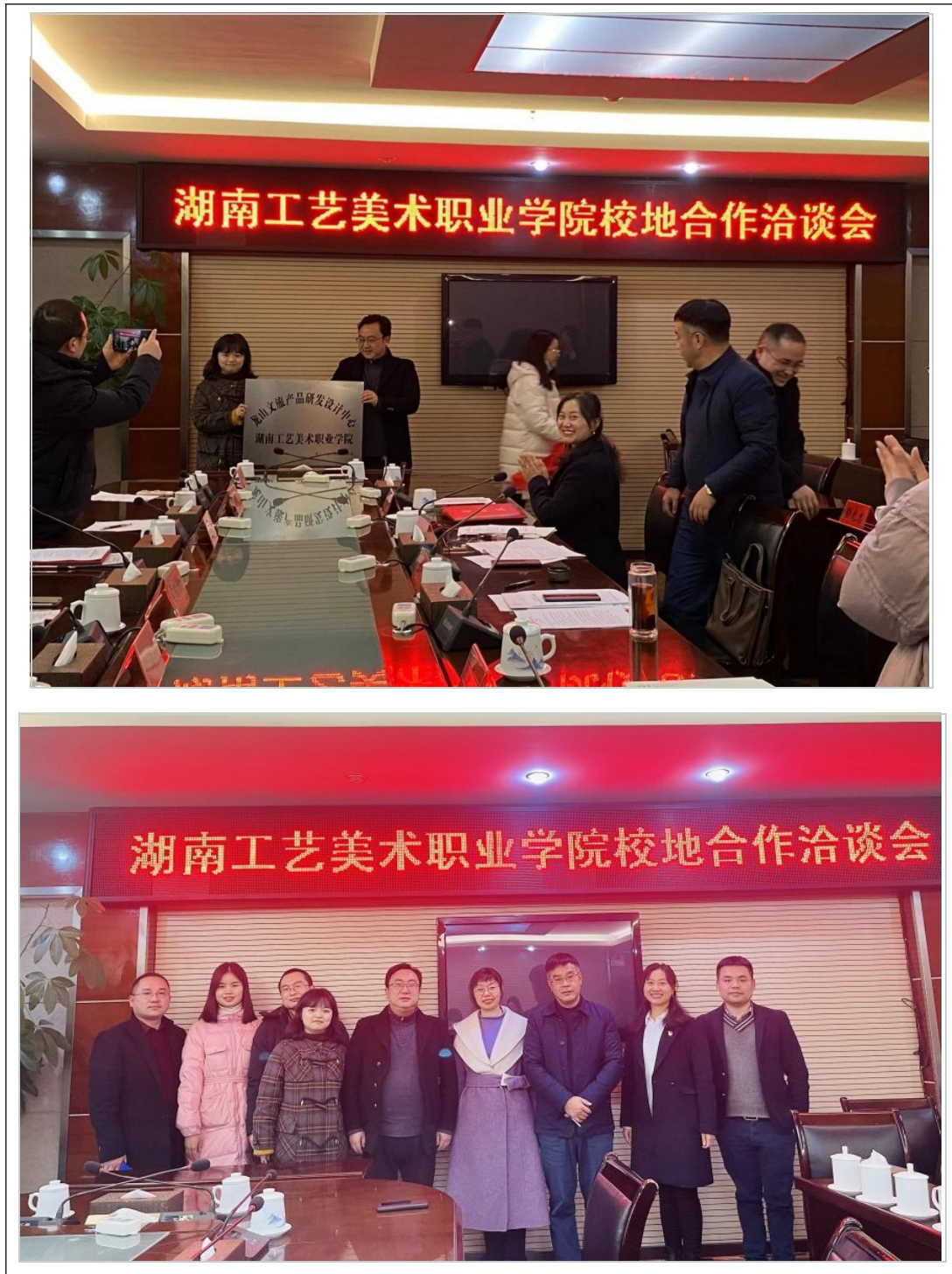
图3 龙山文旅产品研发中心授牌仪式现场