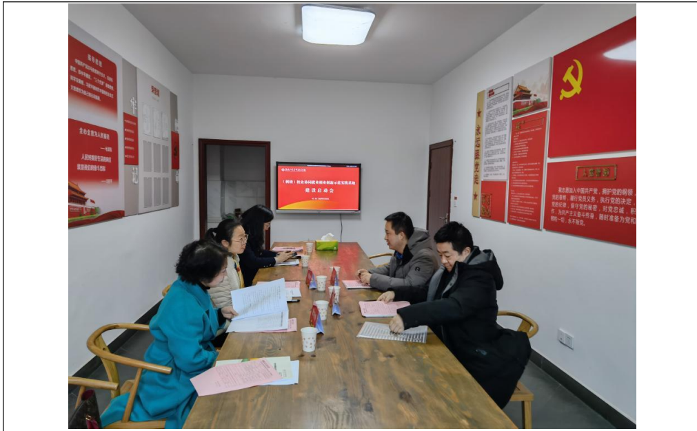
图 1 会议现场