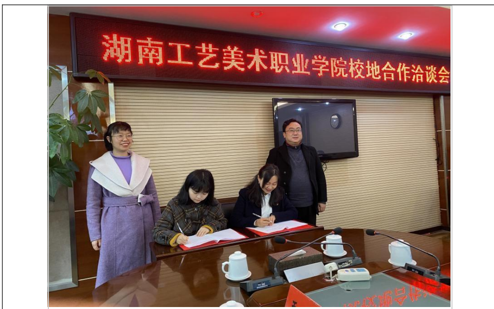
图2 双方代表签署协议