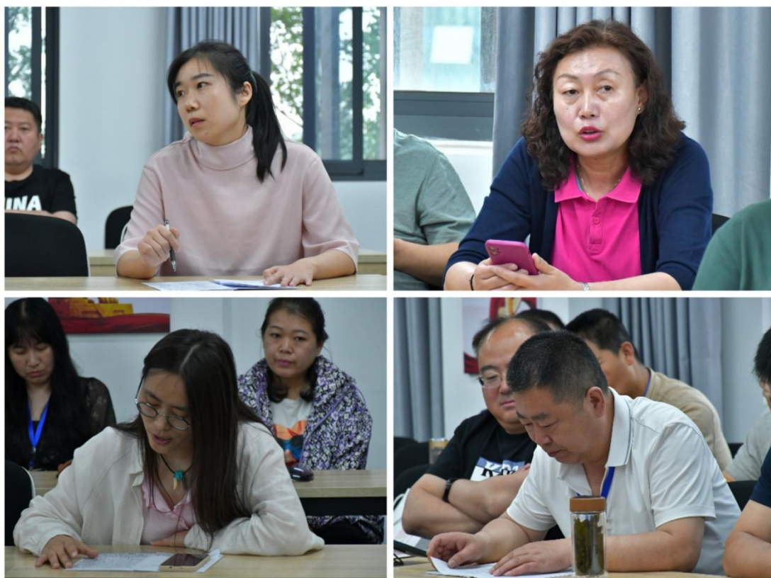
座谈会学员交流发言