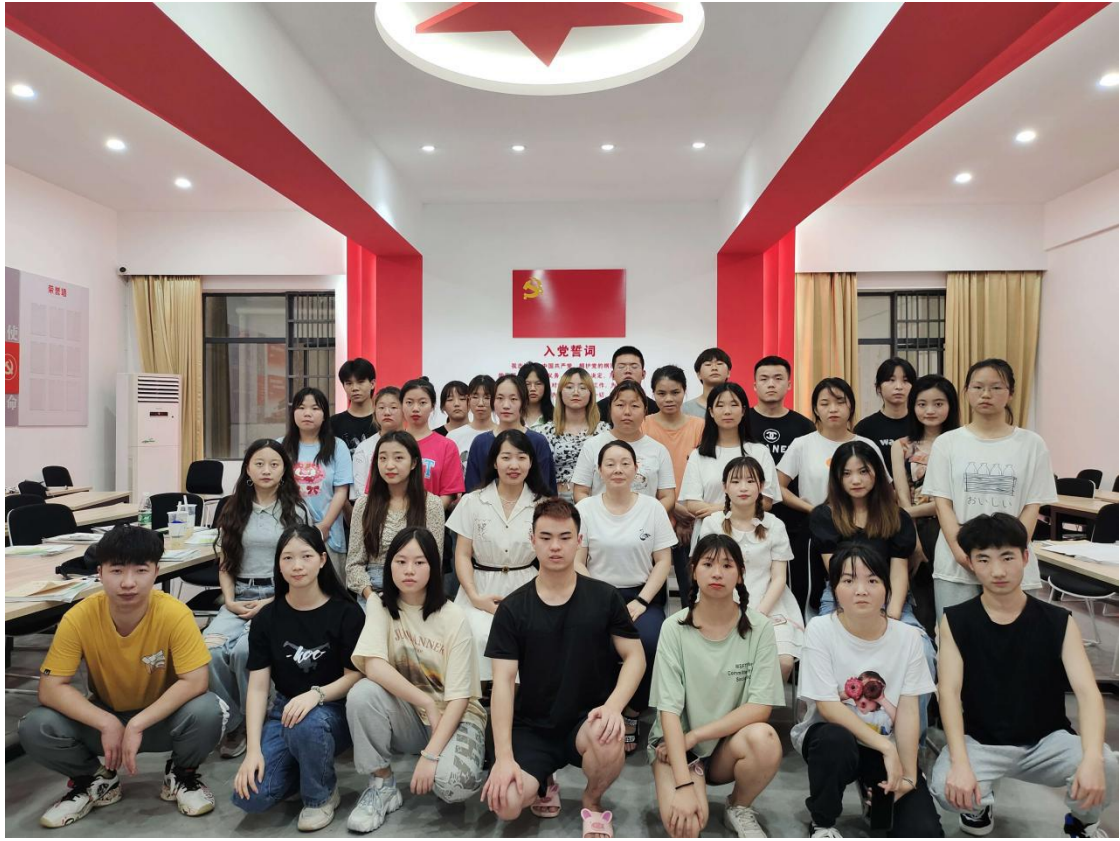
创业培训结业合影