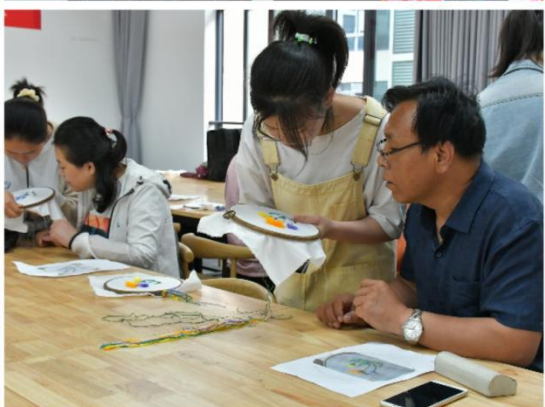
学员体验湘绣制作