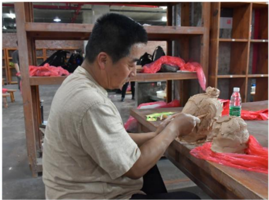
学员体验湘瓷制作