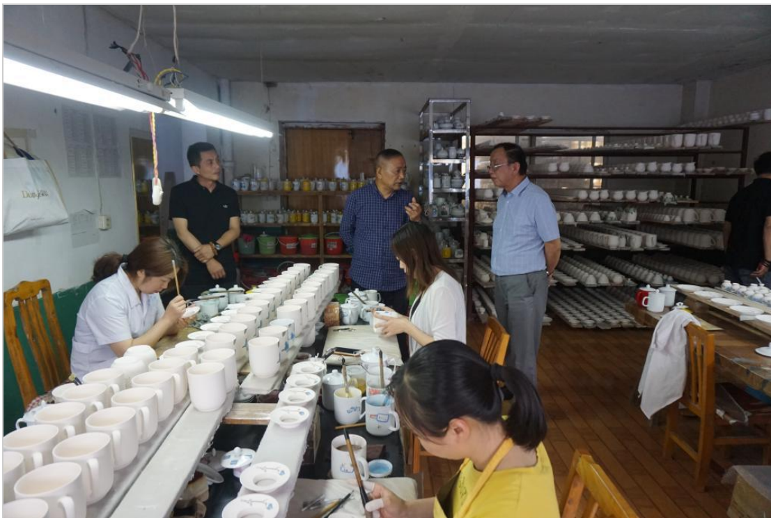
参观湖南省醴陵市官润窑艺术瓷厂生产车间