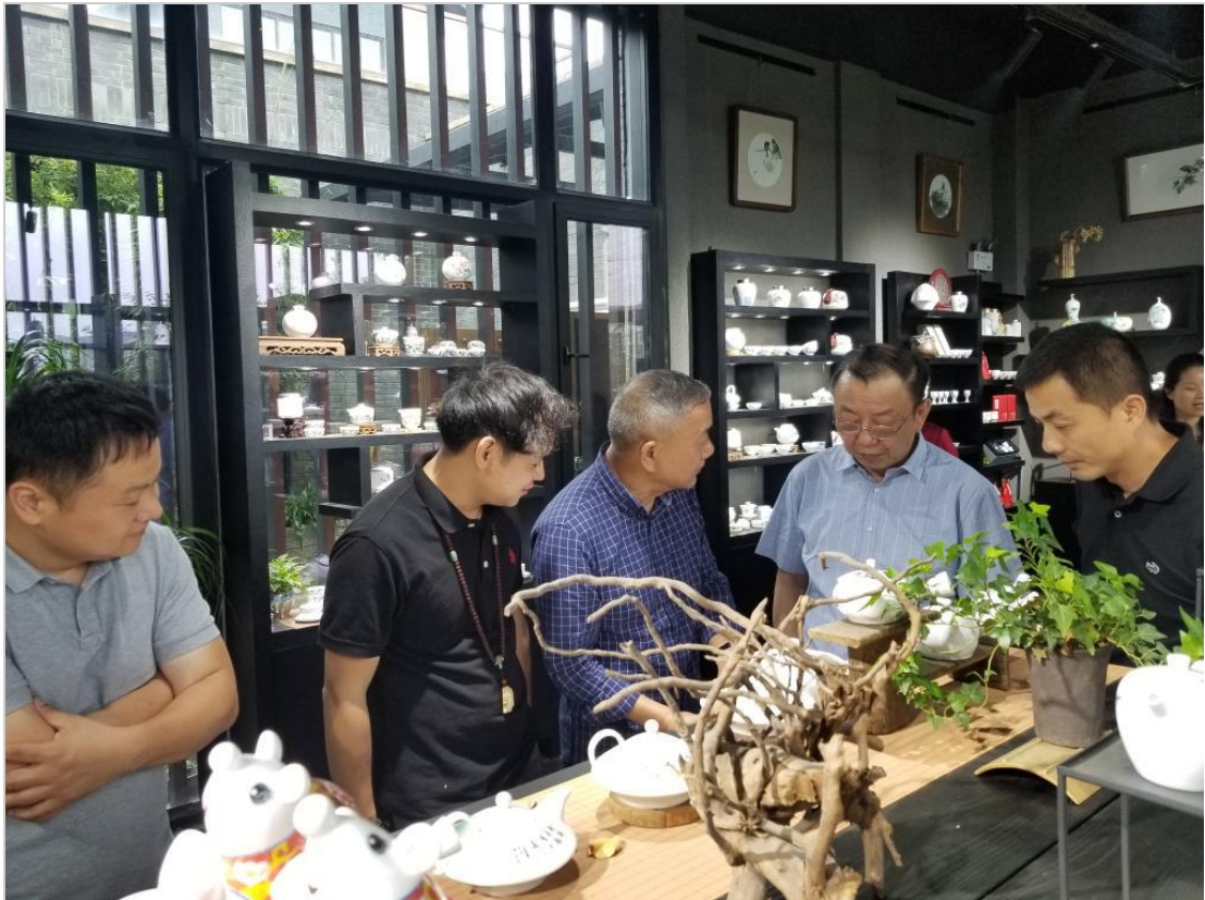
参观湖南省醴陵市官润窑艺术瓷厂产品展览馆