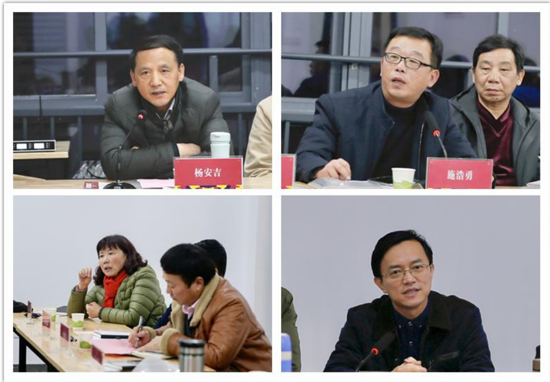
与会人员研讨交流