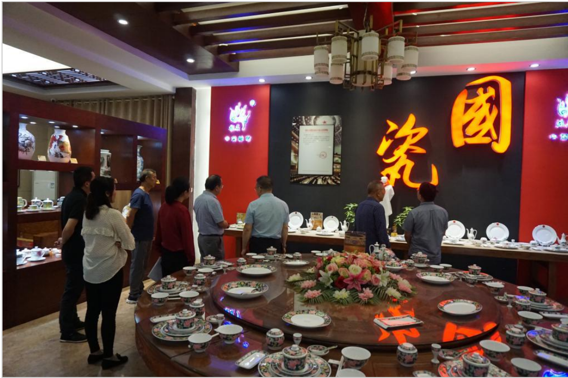
参观醴陵振美艺术陶瓷有限公司“国瓷”展厅