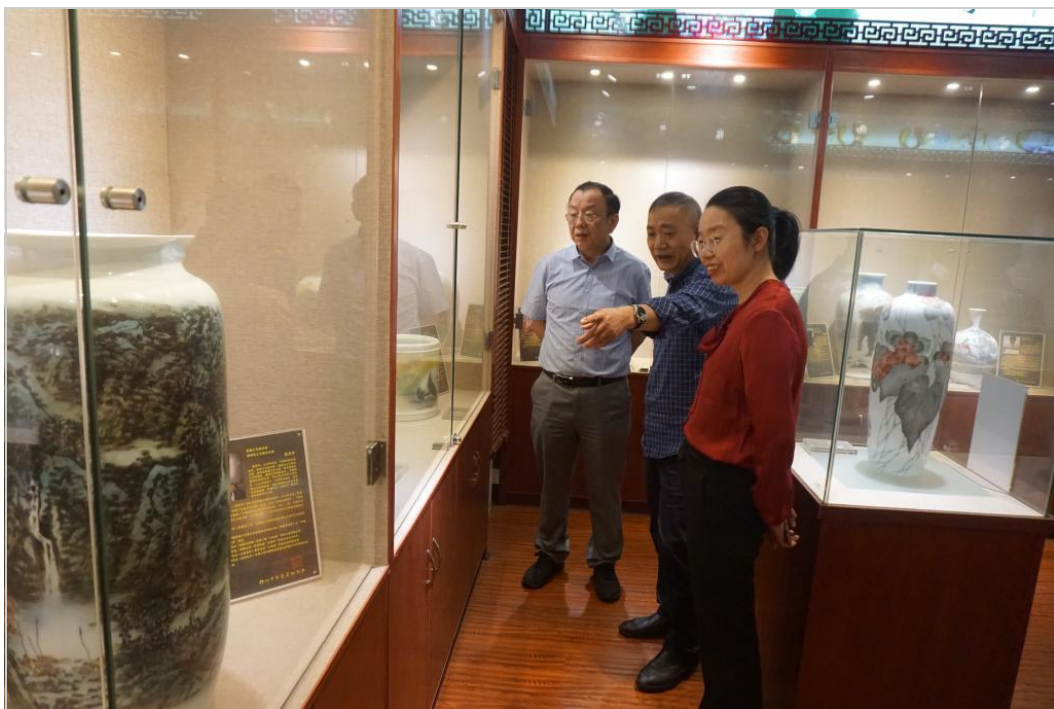
参观株洲市工艺美术协会展厅